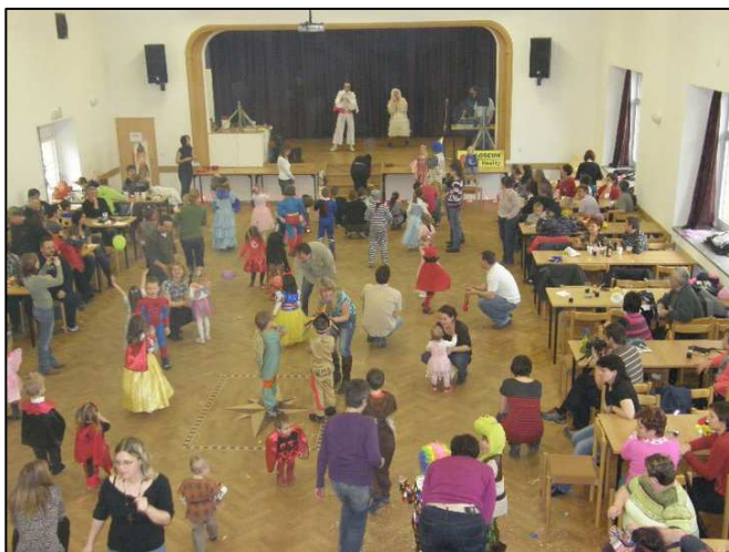
▲ Maškarní karneval pro děti

nakonec vsadili na osvědčenou Podboranku. Naše snaha byla zúročena hojnou účastí na této akci, což pro nás bylo obrovským zadostiučiněním.