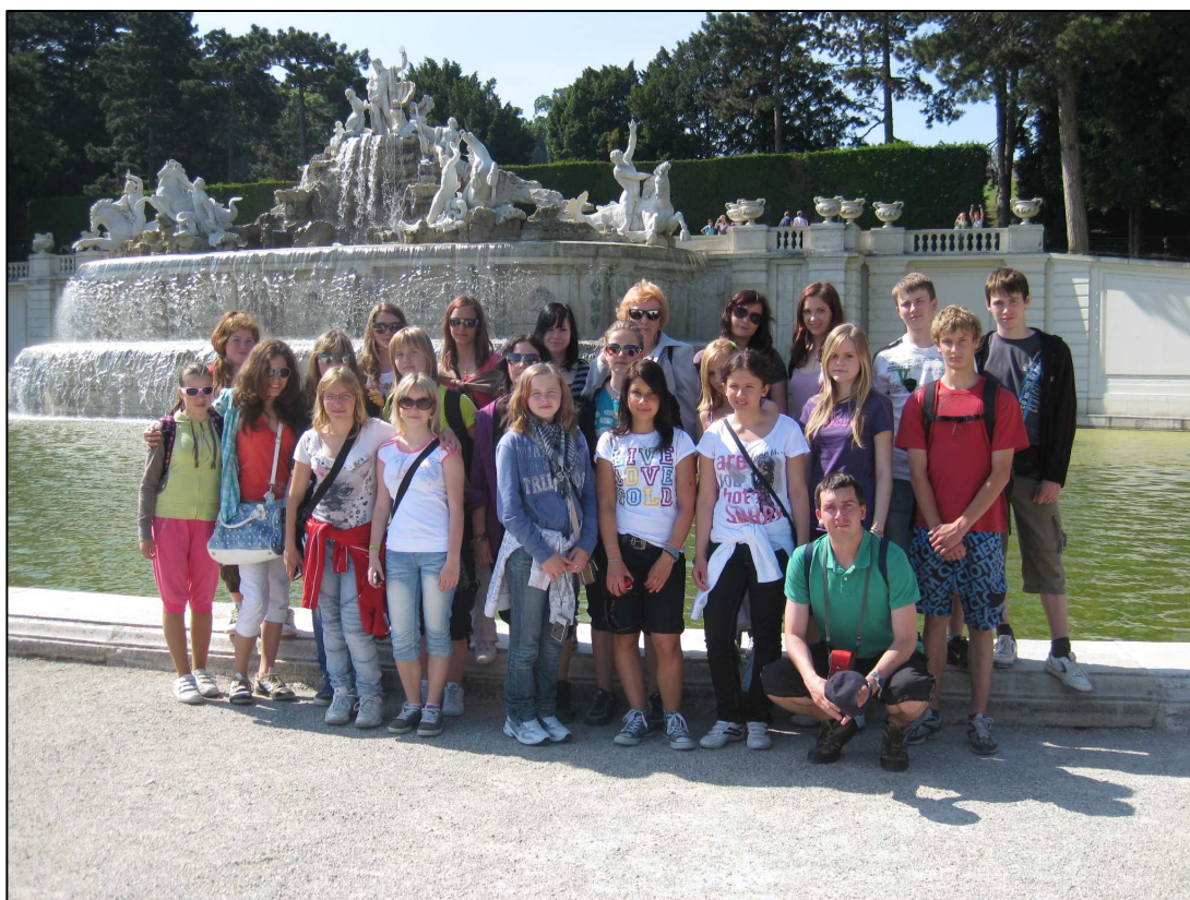
▲ Účastníci zájezdu před Neptunovou kašnou v areálu zámku Schönbrunn

V areálu zámeckého parku žáci shlédli Neptunovu fontánu (Neptunbrunnen), v jejímž vrcholu se tyčí socha Neptuna, boha moře. Park je překrásně architektonicky zakončen Glorietou (Gloriette), kterou tvoří dvě boční otevřené galerie a uprostřed je kavárna, kde dříve snídala sama císařovna s císařem. Z tohoto místa je hezký výhled na Vídeň.