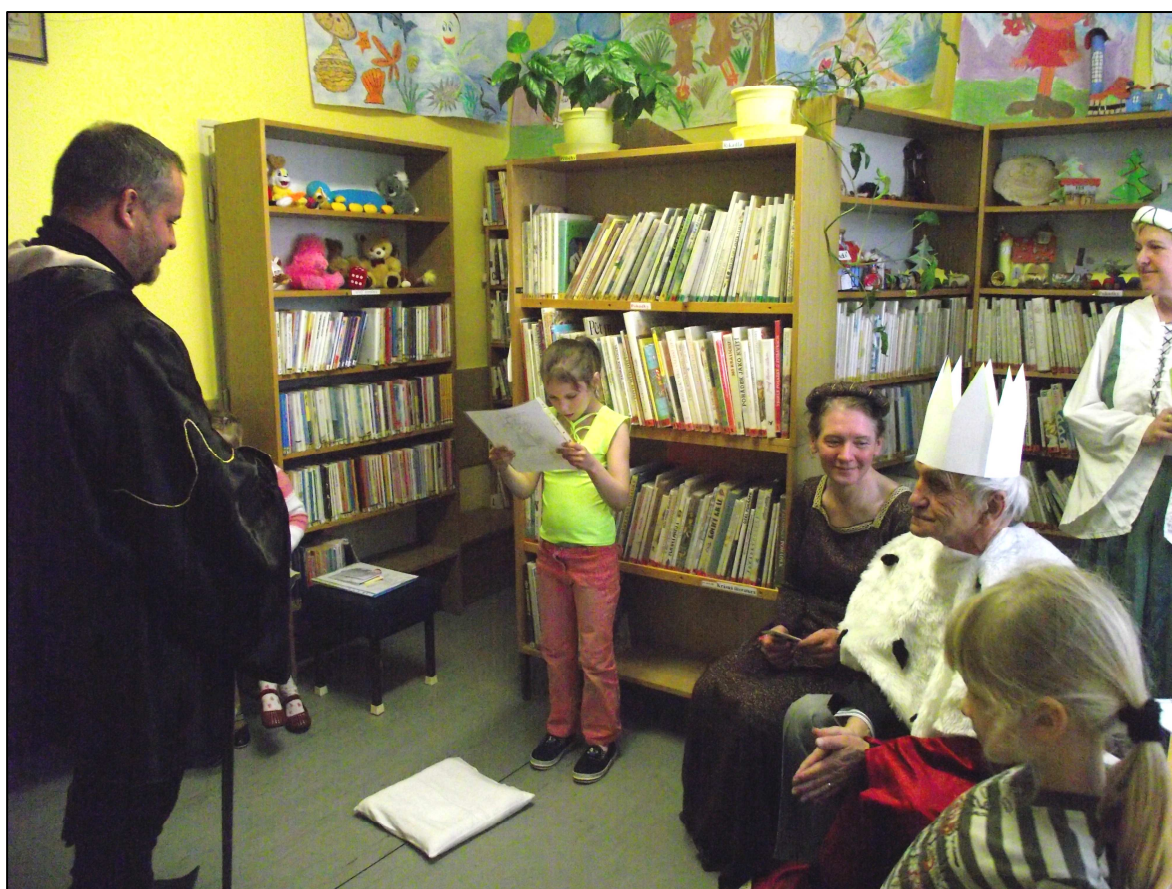
▲ Pasování prvňáčků na malé čtenáře

Fotodokumentaci práce knihovny můžete vidět na našich internetových stránkách: www.knihovnapustimer.wz.cz .