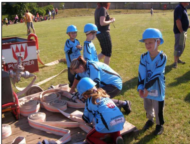
▲ Nejmladší hasičata

Dále jsme v tomto roce měli možnost z dotace, která přišla z JM kraje, vybavit zásahovou jednotku a pořídit dva zásahové komplety Zahas IV, dvě zásahové přilby i se svítilnami, které jsme dokoupili i k ostatním přilbám, které jsme již měli ve sboru k dispozici, kalové čerpadlo, elektrocentrálu a Pracovní stejnokroje II. Tímto ještě jednou děkujeme obci a JM kraji za obdrženu dotaci.