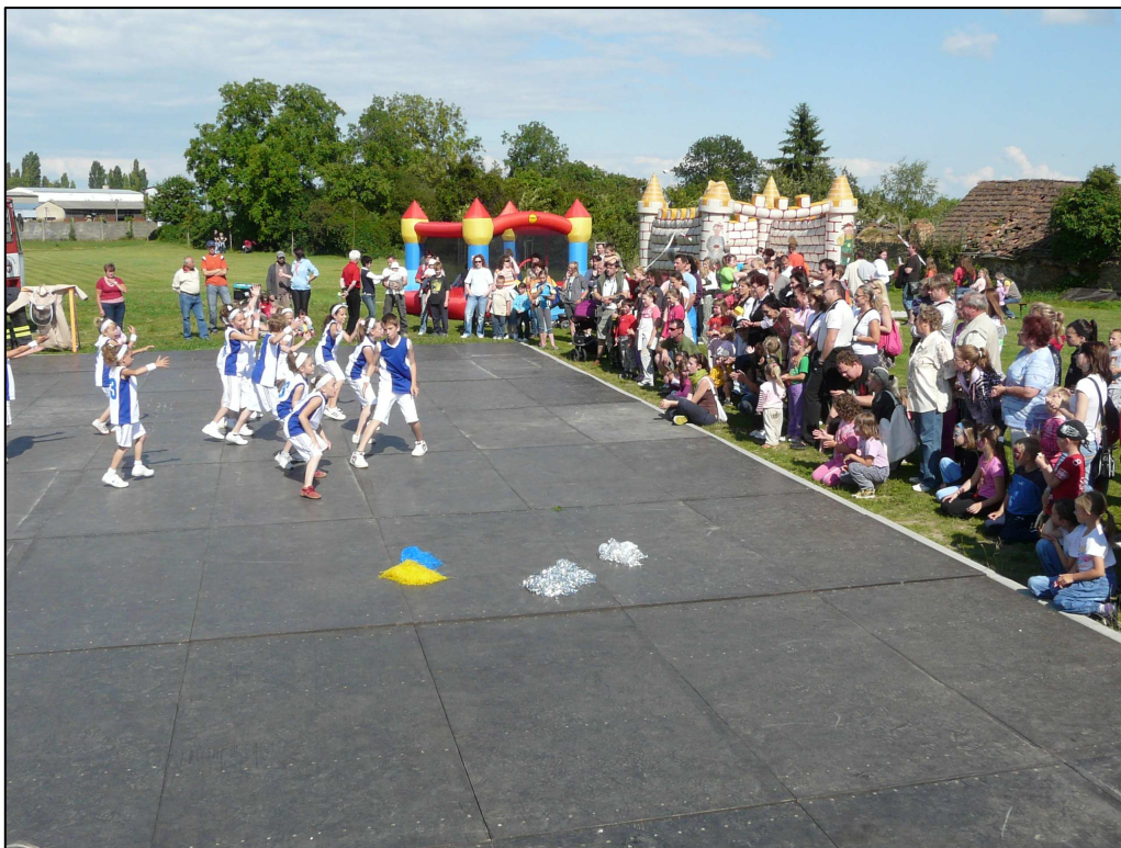
▲ Vystoupení street-danceové skupiny N-joy

Moc děkujeme všem nadšeným maminkám, které se podílely jak na přípravě této akce, tak na celkové realizaci. Dále děkujeme všem sponzorům, Věře a Marcelle Kučerové, Obci Pustiměř a SDH Pustiměř, bez kterých by se tato akce nemohla uskutečnit. Ještě jednou Vám všem moc děkuji.