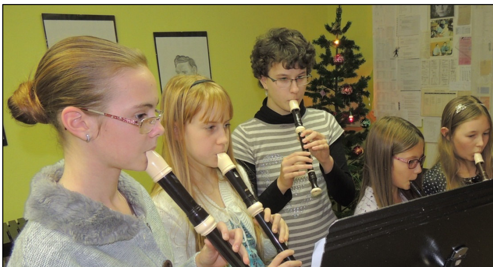
▲ Malí pustiměřští pištci.

Děti ze ZUŠ Ivanovice na Hané, detašované pracoviště Pustiměř, nakreslily a namalovaly pod vedením Yvony Lacinové spoustu překrásných obrázků, které jsme