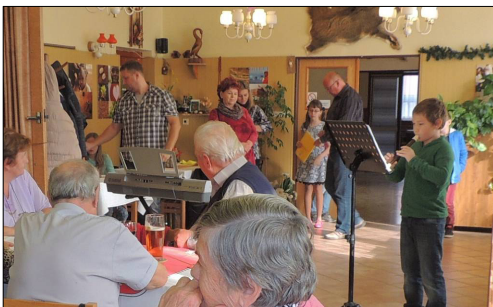
▲ Děti místního detašovaného pracoviště ZUŠ Ivanovice na Hané zahrály pěkné skladbičky.