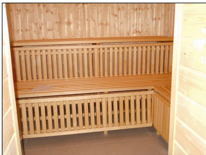
▲ Pohled na nově zbudovanou suchou saunu v budově kabin v areálu fotbalového hřiště.

• V posledních dvou měsících loňského roku byla pro naše občany opět otevřena sauna. Aktivnější byly tradičně ženy, které pravidelně saunu navštěvovaly v počtu 5 až 7 na jeden otevírací den.