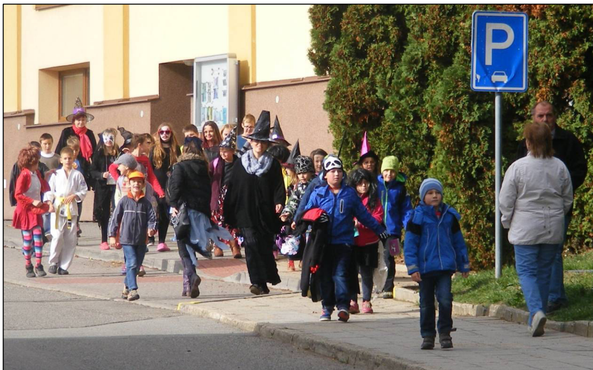
▲ Děti v průvodu předvedly spoustu zajímavých masek.

Trend odklonu dětí od tištěné literatury se projevuje také v naší obci. Zkrátka většina dětí málo čte. Z toho důvodu jsme se rozhodli jejich čtenářské úsilí podpořit, proto Obecní knihovna v Pustiměři a ZŠ a MŠ v Pustiměři za podpory Obce Pustiměř