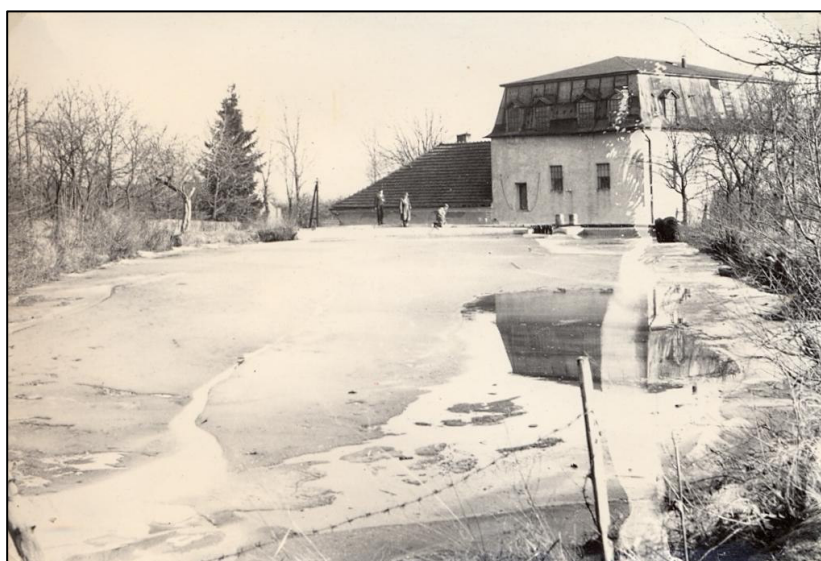
▲ Matouškův mlýn s přilehlým rybníčkem.