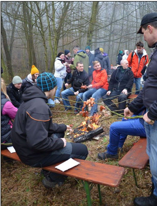
▲ Opékání pod „Meličákem“ při povánoční procházce.

v podobě punče nebo čaje. Předposlední zastávka byla pod Melickým hradem, kde se opékaly špekáčky a dopíjely zásoby, které se ušetřily během pochodu.