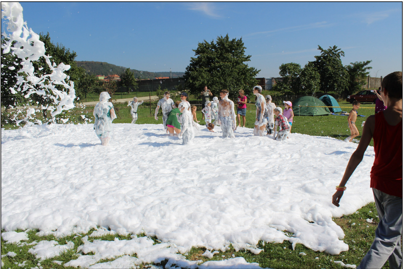
▲ Stanování se SDH Pustiměř, sněžení za hasičkou (30. 8. 2015).