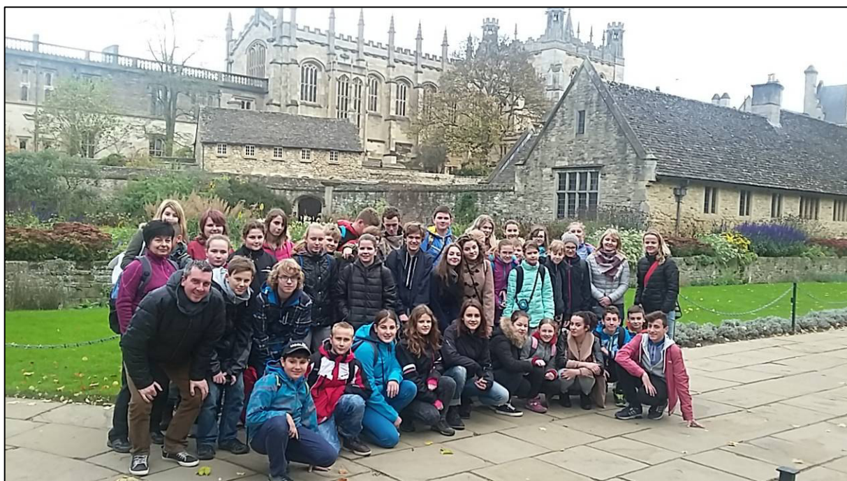
▲ Areál Christ Church College.

Odpoledne patřilo prohlídce univerzitního města Oxfordu. Většina turistických atrakcí má spojitost právě s místní univerzitou, která je nejstarší v Anglii. Nachází se zde celkem 38 kolejí. Jednou z mnoha, které jsme viděli, byla Christ Church, která je jednou z největších. Kolej je poslední dobou známá i díky tomu, že se v jejích prostorách natáčely filmy o kouzelnickém uči Harrym Potterovi. Známymi