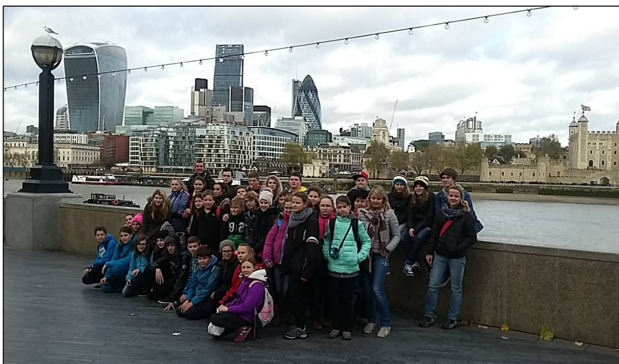
▲ V pozadí ústřední část Londýna zvaná „City“.

5. den: Po včerejším deštivém dni a větrné deštivé noci jsme měli obavy, aby nám počasí nezkazilo i další, poslední den. Čekala nás totiž druhá část celodenní návštěvy Londýna. Zaparkovali jsme ve čtvrti Greenwich v blízkosti O 2 areny, kde se konají koncerty a sportovní akce. Odtud jsme metrem přešli do čtvrti City, která je v současnosti baštou obchodu a financí. Zde pak začala naše procházka po obou březích řeky Temže, během které jsme zhlédli řadu památek: hrad Tower of London,