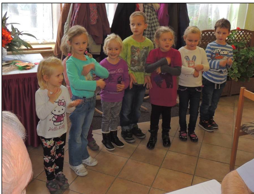
▲ Děti z mateřské školy přednášely a zpívaly.