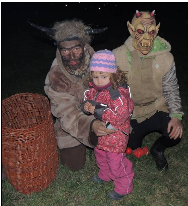
▲ Čertů se nabály ani nejmeší děti. Asi byly všechny po celý rok hodné.

V pátek 9. října 2015 jsme navštívili za hasičskou zbrojnicí ekoodpoledne se soutěžemi a sázením stromu přání u čističky, pořádaný Pustiměřskými hasiči a ZŠ a MŠ Pustiměř za podpory obce Pustiměř.