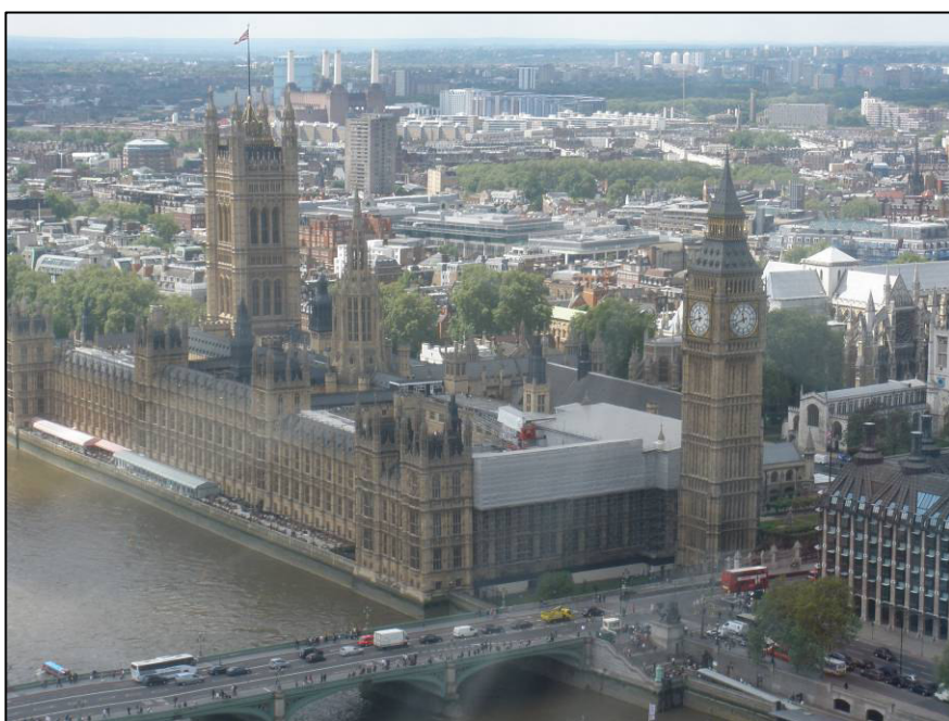
▲ Pohled na budovu Parlamentu a Big Ben z Londýnského kola.

zastávkami byly čínská čtvrť Soho, Covent Garden – centrum kejklířů s trhem a