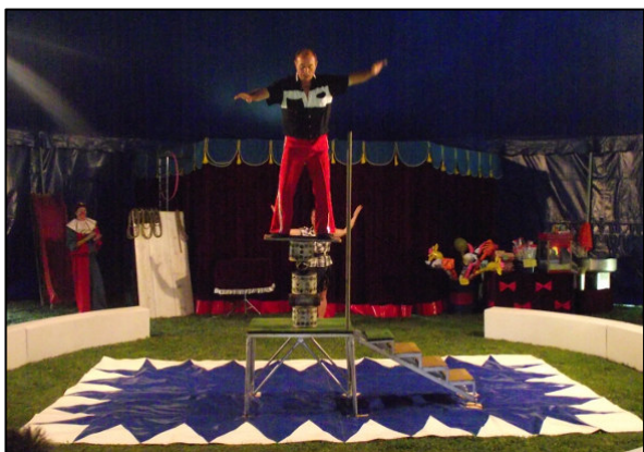
▲ Vrcholným číslem bylo balancování na pěti válcích.

O prázdninách 9. srpna 2015 jsme na hřišti za hasičskou zbrojnicí opět přivítali cirkus Carneval. Viděli jsme drezúru malých psíků, žonglérské umění a kouzlení jeho artistů. Vrcholným číslem bylo balancování na pěti válcích. Nezapomněli ani na děti. Zapojili je do kouzelnických čísel a legračních scének. Za odměnu dostaly sladkou odměnu. Děti i dospělí se dobře bavili.