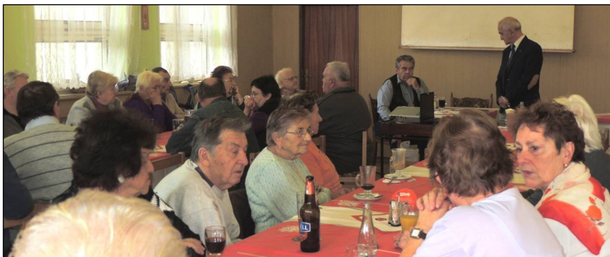
▲ Představitelé Obce přítomné seznámili s aktivitami jejího vedení.

Poté jsme si prohlíželi fotografie pořízené na rozmanitých akcích konaných v období od posledního setkání, doplněné krátkou informací o dění na nich.