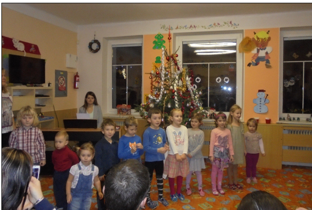
▲ Vystoupení žáků u stromečku v místní MŠ (15. 12. 2015).