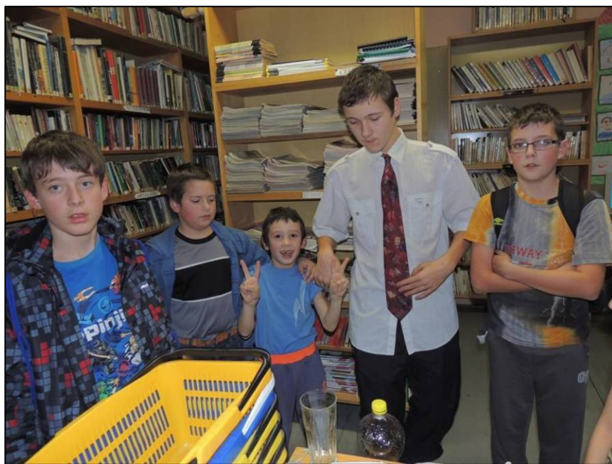
▲ Soutěžící, kteří dokončili virtuální turnaj FIFA v knihovně.

Mimo program knihovny jsme navštívili i akce dalších organizací v Pustiměři. Od pátku 28. do neděle 30. srpna 2015 rodiče s dětmi stanovali za hasičkou. Pro děti bylo připraveno množství her a soutěží stezka odvahy, promítání pohádek, sobotního večerního programu se mohli zúčastnit i ostatní obyvatelé a návštěvníci