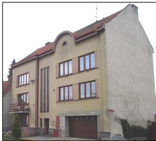
▲ Bývalý Potáčův mlýn.