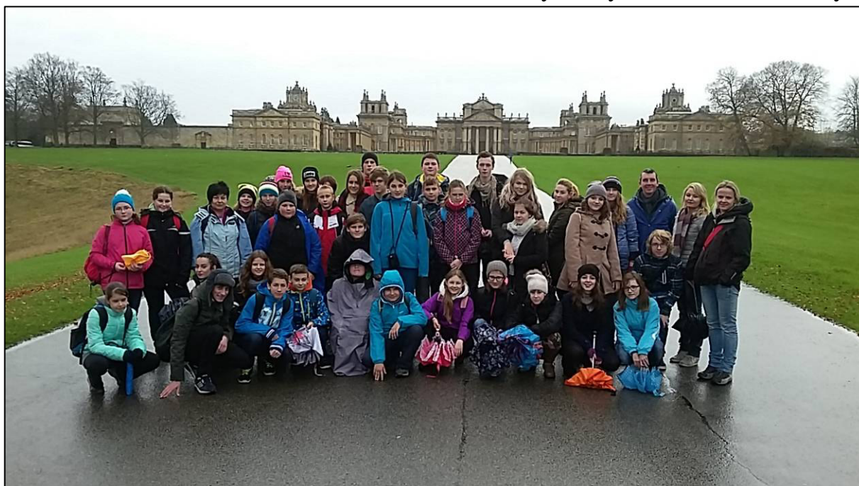
▲ Společné foto před Blenheimským palácem.

Blenheimský palác je opulentní venkovské stavení, které patří od 18. století rodu Churchillů, kteří ho dostali darem od Královny Anny. Narodil se zde i bývalý