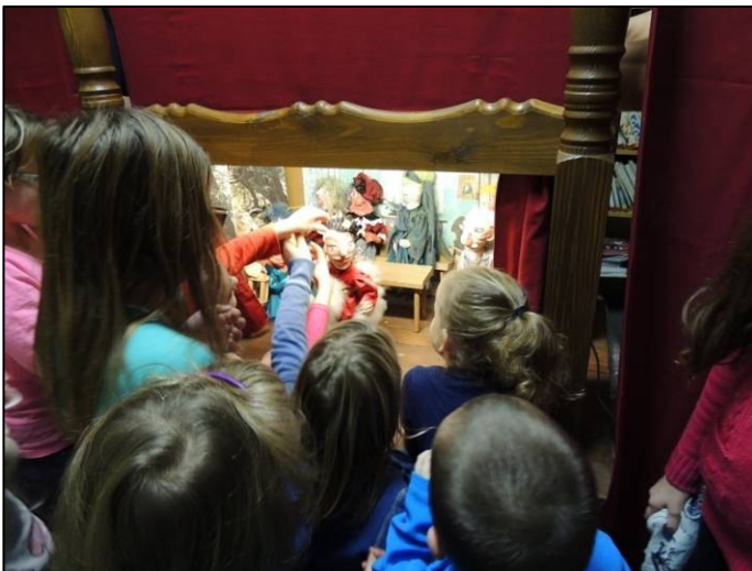
▲ Děti hladily loutky a nejraději by si je vzaly domů.

Posledním divadelním představením v roce