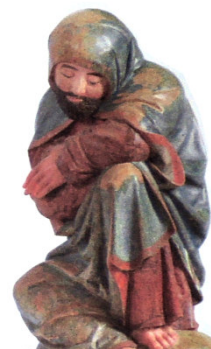
▲ Sv. Jakub, nyní v Olomouci. Foto instalace v Getsemanské zahradě v Pustiměři: Anna Hrozová.

Typickým umístěním olivetských hor, byly hřbitovy kolem kostelů. Později se však hřbitovy stěhovaly mimo obce. Olivetské hory se ocitly v nových souvislostech, ty volně stojící skupiny dokonce v novém, profánním prostředí, kde mohly překážet. Sousoší byla přemístována na nová místa (různé přístavby, boční kaple, nové přístřešky, do kostelů). 8 Naše Getsemanská zahrada, která je kulturní památkou související s kaplí svaté Anny a spolu s ní byla zapsána na seznam kulturních památek 9 3. května 1958, původně také shlížela na hřbitov, který se nacházel kolem starého kostela sv. Benedikta, který byl dokončen koncem 16. století. Byl to podle Janského kroniky čtvrtý kostel v Pustiměři a postaven byl ve slohu renesančním s jednou chrámovou lodí. Dřevěná zvonice stála níže mezi dvěma lípami zasazenými na konci 19. století. Jedna uhynula při požáru kostela, druhá u nového kostela sv. Benedikta, postaveného v roce 1902, roste dodnes a je také chráněná památkovým úřadem. Při jižní venkovní boční zdi starého kostela stávala Getsemanská zahrada původně. Po jeho požáru mu klenba popraskala a byla rozebrána a nový strop byl postaven ze dřeva. Po čase byl kostel znovu zaklenut. Zbořen byl pro špatný stav zdiva roku 1898. Od jeho zdi byla Getsemanská zahrada přemístěna ke zdi farské zahrady mezi kostelem a kaplí svaté Anny. Pochází asi z poloviny 15. století. Její přesné stáří není známo. Víme jen, že podobná, vyvedená v kameni je v Olomouci. 10