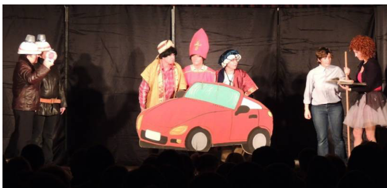
▲ Na jevišti v autě.

Posledním představením, které se konalo v naší Sokolovně 21. listopadu 2015 před pojistnou událostí, byla Dívka na koštěti podle stejnojmenného filmu v úpravě