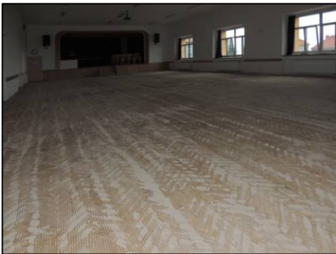
▲ Parkety na sále v Sokolovně vzaly za své a musely se odvézt.

Nikdo z nás netušil, že sérii kulturních programů již následujícího dne ukončí nehoda vodovodního potrubí na sociálním zařízení. Jediná prasklina způsobila, že do sálu Sokolovny natekla voda do výše pěti centimetrů a zničila parkety, kterými byla obložena jeho podlaha. Na nápravě situace se intenzivně