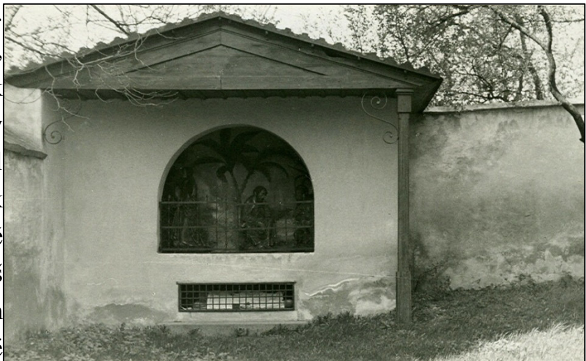
▲ Getsemanská zahrada v Pustiměři před poškozením na začátku 70. let.

strachu nezůstává skryté. Avšak tam, v návalu úzkosti, se Ježíš utíká v modlitbě k Otci. Onoho večera v Getsemanech to byl vyčerpávající boj, tak urputný, že pot na Ježíšově tváři se mění v krev. A Ježíš neváhá naposled před Otcem vyznat své rozechvění, které jej proniká: „Otče, chceš-li, odejmi ode mě tento kalich!