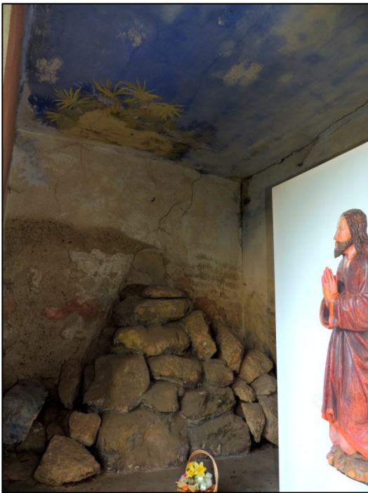
▲ Zbytek původní výzdoby Getsemanské zahrady v Pustiměři.

Této skupině byly věnovány specifické projevy úcty, konaly se u nich různé druhy pobožností. Jejím předobrazem je zahrada Getsemanská, která se nachází na úpatí Olivetské hory v údolí Cedronu. 11 Podle Bible zde Ježíš bděl a modlil se tu noc, kdy byl zatčen a později ukřižován. Podle Lukášova evangelia. Ježíšova muka v zahradě Getsemanské byla tak strašná, že „jeho potem byly velké krůpěje krve padající na zem“. 12 Dr. Josef Beníček uvádí: „Nastala hodina“ (Jan 16,32), hodina, vnímaná už od počátku, oznámená apoštolům, hodina, jež není žádné jiné podobná, která je všechny obsahuje a zahrnuje, právě když se završují v náručí Otce. Znenadání ta hodina nahání strach. Nic nám z tohoto