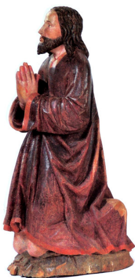
▲ Ježíš Kristus, nyní v Olomouci.