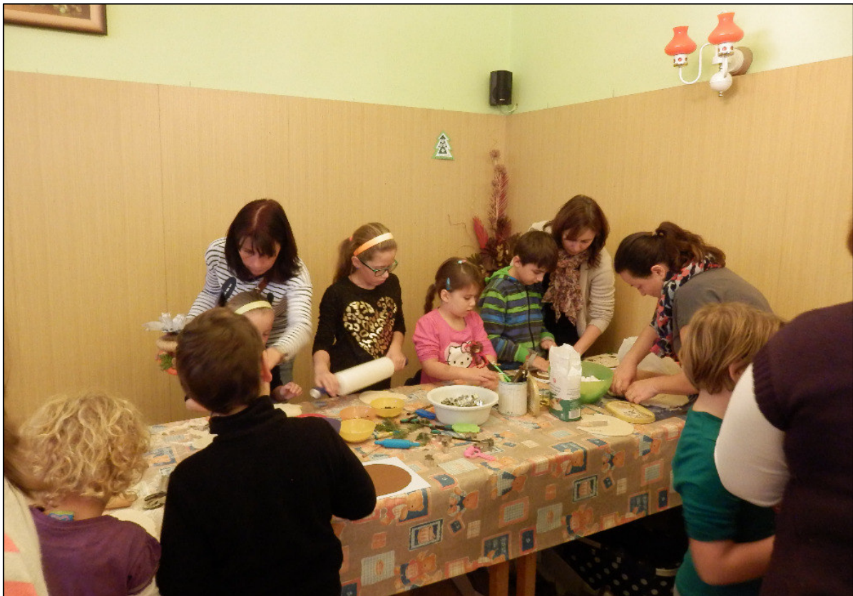
▲ Vánoční tvoření s MC Stonožka (15. 11. 2015).