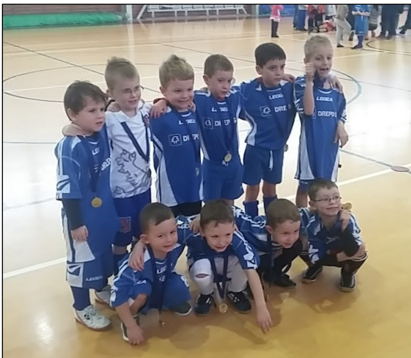
▲ Družstvo předpřípravky na halovém turnaji ve Vyškově, ZŠ Purkyňova.

„V letošním roce jsme opět uspořádali nábor mladých talentů. Na nábor přišlo mnoho nadějí a do dnešního dne chodí na tréninky kolem patnácti dětí. Děti trénují dvakrát týdně po dobu jedné hodiny. Jsou to především děti ve věku od čtyř do šesti let. Jejich