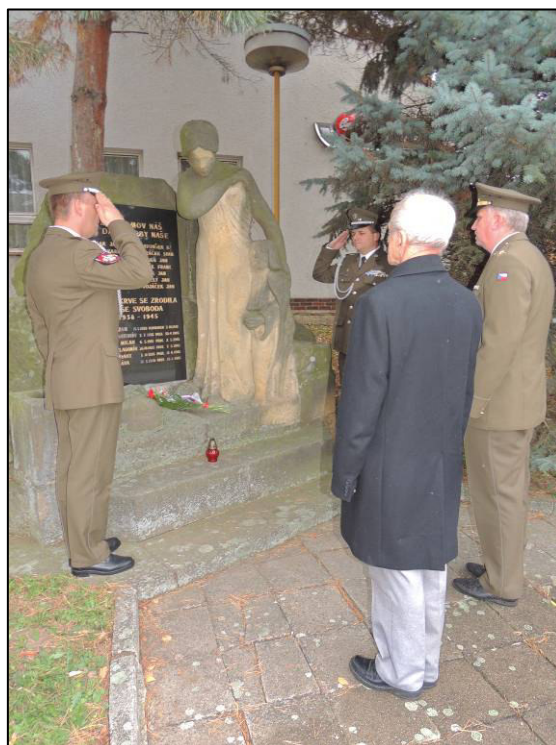
▲ Uctění památky veteránů všech válek (11. 11. 2015).