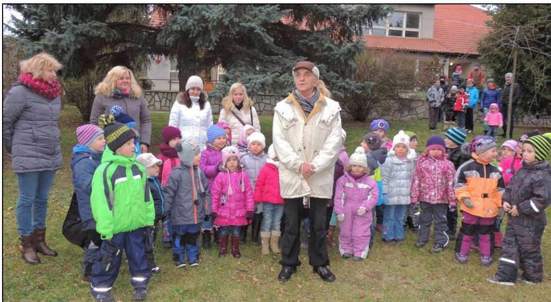
▲ Rozsvěcení vánočního stromu v pruském parku.

V týdnu od 20. do 24. 10. 2015 nás navštívili pracovníci brněnského rozhlasu, aby seznámili s pamětihodnostmi a životem občanů v naší vesnici ostatní obyvatele, především v Jihomoravském kraji.