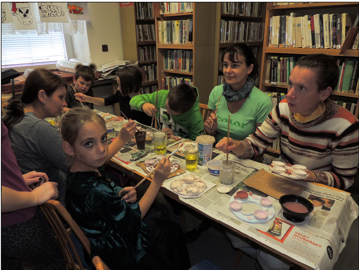
▲ Glazování v knihovně (23. 10. 2015).