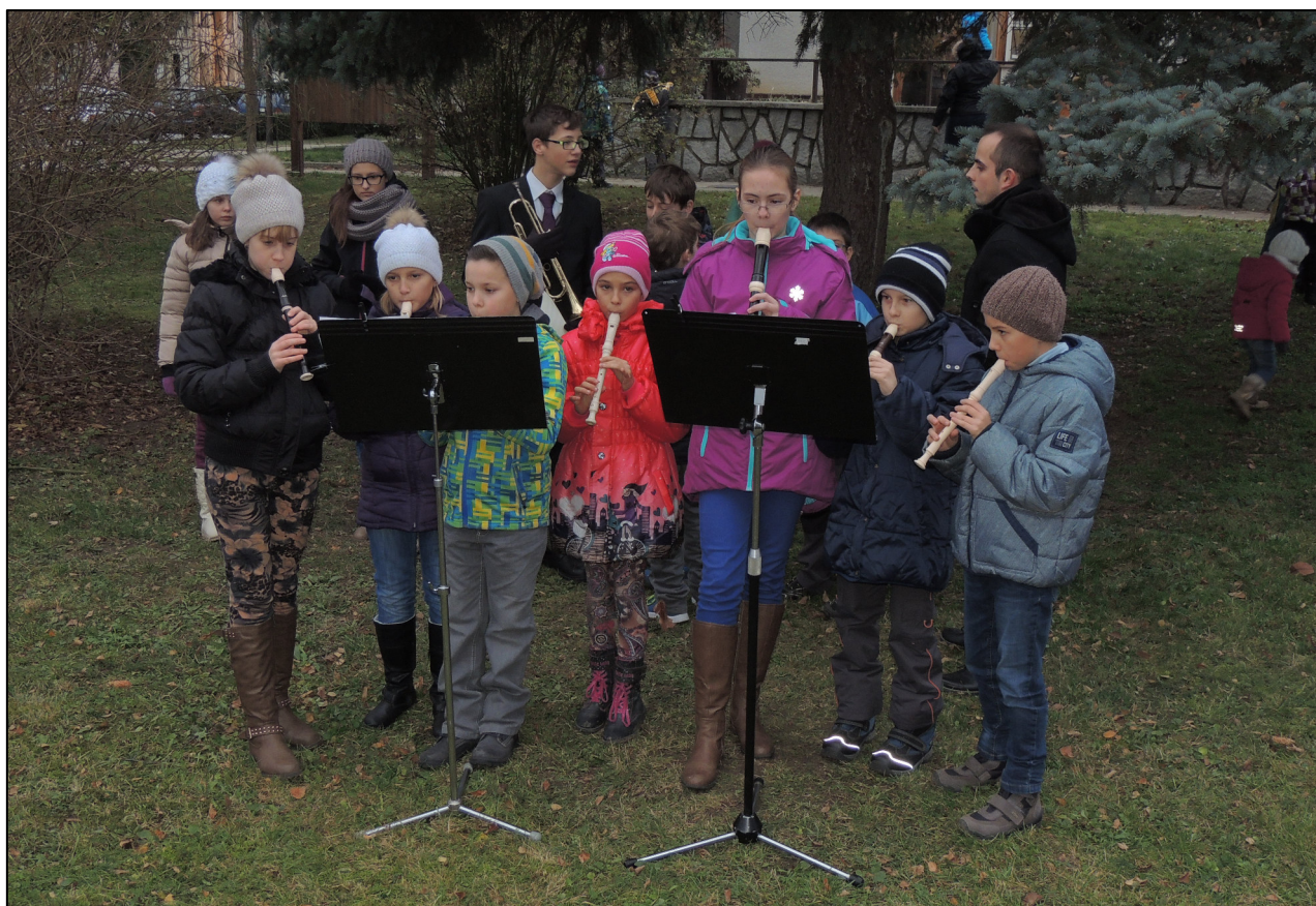
▲ Rozsvěcení vánočního stromečku (29. 11. 2015).