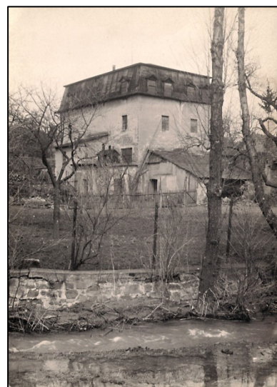
▲ Matouškův mlýn na č. p. 55.