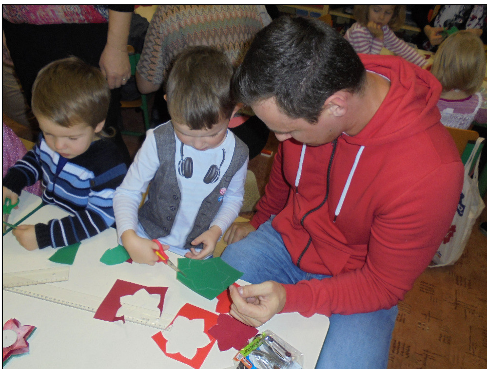
▲ Vánoční tvoření v MŠ Pustiměř.

krásnou vánoční atmosférou. Pak už jsme jen čekali, jestli nám přes noc Ježíšek nadělí pod stromeček nějaké ty dárečky. Všichni jsme se ráno do školky těšili ještě víc, než obvykle. Pod stromečkem na všechny děti čekala spousta dárečků a dokonce každý dostal jeden dáreček, který si mohl odnést domů.