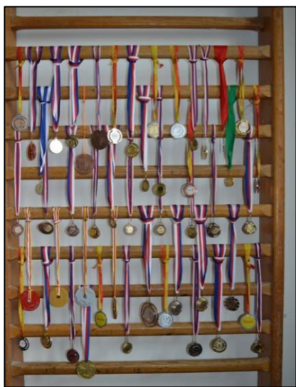
▲ Spousta medailí, které získali pustiměřští lezci.