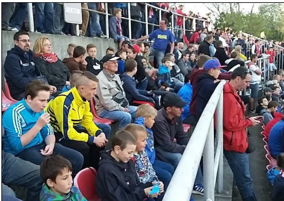
▲ Pustiměřští diváci na utkání I. ligy Brno – Sparta.

Z již tradičních akcí fotbalisté pořádali „stavění máje“, které opět přilákalo početnou veřejnost z řad dospělých i dětí. Pro děti i pro dospělé bylo připraveno bohaté občerstvení, zábavné soutěže a tombola. Ve spolupráci s Obcí Pustiměř bylo pro děti připraveno opékání špekáčků.