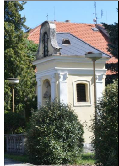
▲ Zvonička 7. 7. 2016.

Obec však na zvoničku nezapomíná ani dnes. V letošním roce nechala zbudovat novou moderní a trvanlivou střechu. Opravu provedla firma Střechy Daněk a Štrajt v hodnotě 79 500,- Kč. Doufejme, že upravená zvonička, kulturní památka 29980/7 – 3765, bude ještě dlouho přitahovat svou krásou naše oči a patroni, kteří jsou v ní domovem, budou naši obec „ochraňovat“ i nadále.