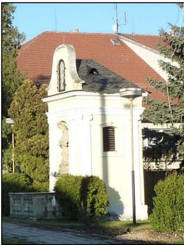
▲ Zvonička v roce 2014.

rozhlasem se šíří zvuk zvonu, je-li tomu třeba.