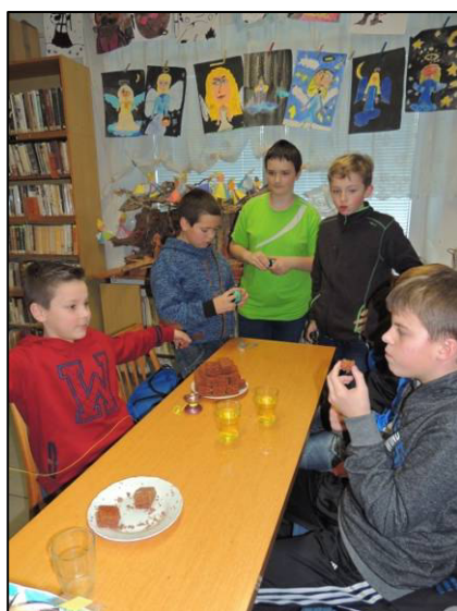
▲ Hoši sami si připravili jojóvání.

Právě od 13. roku věku se děti mohou se svými projekty hlásit do této soutěže, jejímž hlavním oceněním je návštěva trenážeru raketoplánu a třešničkou na dortu je účast právě v posádce kosmické lodi ve Vyškově.