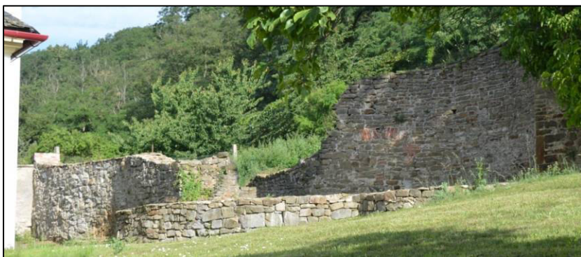
▲ Rotunda 2. 7. 2016.

Jedním z nich byl i Otec vlasti Karel IV., jehož 700. výročí narození si letos připomínáme.