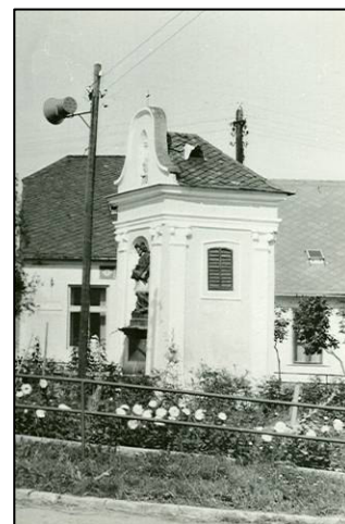
▲ Zvonička v šedesátých letech 20. století, Foto: Rudolf Štolfa st.

V parku vedle obecního úřadu stojí již od konce třetí čtvrtiny 18. století malá zvonička. Před několika desetiletími byla velice důležitá. Každý den nám připomínala poledne. Zvonilo se zde klekání. Její zvonek nám oznamoval, když některý s obyvatel obce odešel na věčnost, a provázal jej svým naléhavým hlasem při cestě na hřbitov. Svolával také všechny občany v případě nebezpečí nebo požáru. Dnes se ve stěnách malé místnůstky rozprostírá ticho. Její funkce převzal obecní rozhlas. Poledne i podvečer nám připomíná pravidelné hlášení,