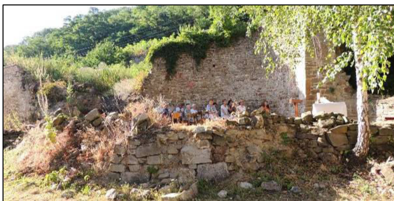
▲ Mše v rotundě sv. Pantaleona 27. 7. 2015. Vidíme rozrušenou jižní nižší zeď lodi rotundy.