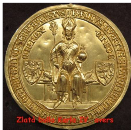
▲ Zlatá bulla Karla IV. avers.

Sepsal české královské právo - Maiestas Carolina. 6 Již jako císař nechal vytvořit Zlatou bulu, nejvýznamnější říšský ústavní zákon, který platil až do zániku Svaté říše římské roku 1806. 7 Roku 1348 také založil Nové Město pražské, postavil Karlův most, Karlštejn 8 , který se měl stát nedobytnou pevností střežící říšské a české