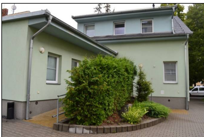
▲ Charita - chráněné bydlení.

Pokud máte v rodině někoho, kdo potřebuje během dne dohled a současně chce být mezi lidmi, můžete kontaktovat vedoucího služby p. Němečka na čísle 604 211 012. Služba funguje ve všední dny v čase 7:00 – 16:00.