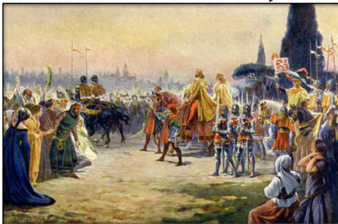
▲ Karel IV. se svou manželkou Annou Svídnickou přijíždí do Říma k císařské korunovaci.

Císařská korunovace se konala 5. dubna 1355 v Římě. Od této byl Karlem IV. Při zpáteční cestě se císař s císařovnou ubytovali v Pise. Zde však došlo k povstání a palác, ve kterém císařští manželé přenocovali, byl podpálen, takže Karel IV. a jeho manželka si museli zachránit život útekem v nočních úborech. V následujících dnech Karel odboj potlačil.