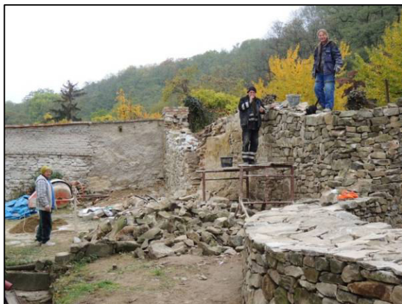
▲ Pracovníci firmy pana Crhonka při opravě rotundy sv. Pantaleona v roce 2015.

Náklady na opravu původně hřbitovní zídky, která spojuje Vávrovu zahradu s rotundou, dosáhly 150 000,- Kč a rekonstrukce torza rotundy 216 000,- Kč. Oba objekty jsou zařazeny v dotačním programu.