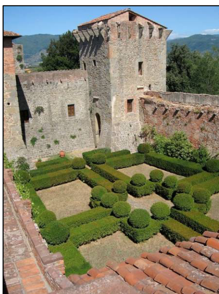
▲ Pevnost Montecarlo, založená Karlem IV. v Itálii.

Karel IV. byl jedenáctý český král, vládnoucí jako Karel I. od srpna 1346 až do své smrti v listopadu 1378. Karel IV. byl římsko-německý král od července 1346 a od