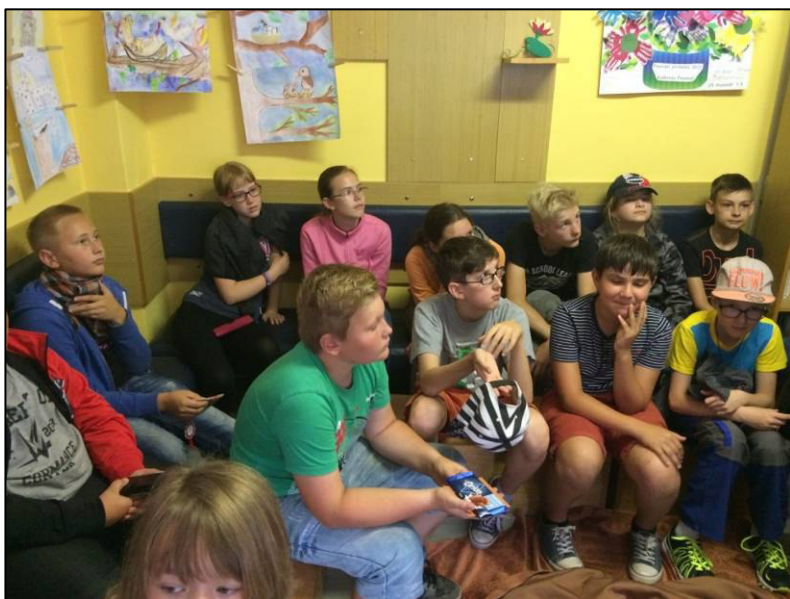
▲ Knihovna byla plná čtenářů, kteří pozorně poslouchali povídání svých druhů o hrdinech, kteří je zaujali.

Žáci si zapisovali knihy od října do konce května. Velký dík patří všem