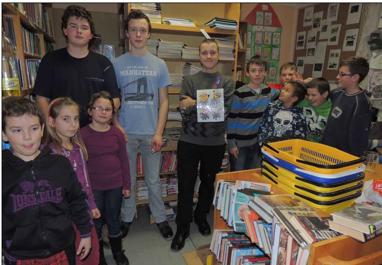
▲ Turnaj v dárce v místní knihovně (5. 2. 2016).