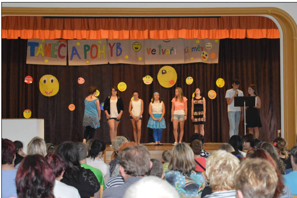
▲ Momentka z vyhlášení soutěže O neaktivnějšího žáka ZŠ Pustiměř v Sokolovně (16. 6. 2016).