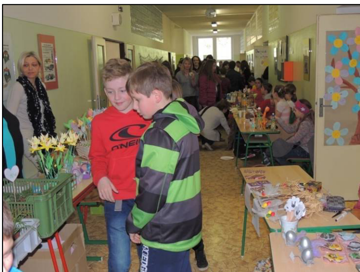
▲ Návštěva Jarmarku byla velice hojná.

Stejně jako v minulých letech jsme mohli navštívit velikonoční školní jarmark.