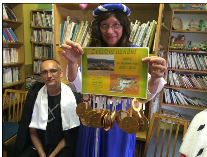
▲ Žáci 6. třídy získali sladké uznání.

Poté 6. třída, která dosáhla nejvíce bodů v průměru na jednoho žáka a ostatní třídy nechala daleko za sebou, dostala pamětní diplom, aby jim připomínal jejich obdivuhodný úspěch. Spolu s nimi byla oceněna i jejich třídní učitelka, která všechny čtenáře při pasování vyfotografovala. Do této třídy chodí i Marie Vejpustková z Drysic, která získala nejvíce bodů ze všech dětí a