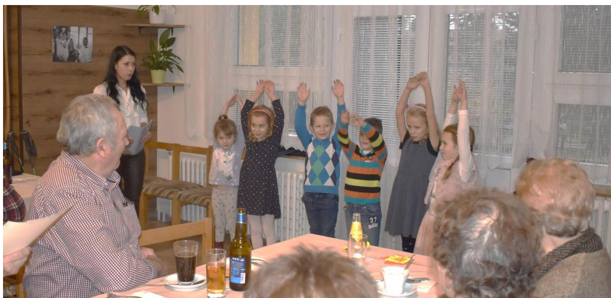
Obrázek 38: Děti předvedly našim dříve narozeným spoluobčanům krátké pásmo písniček a básniček. A za ně byly bohatě odměněny potleskem. Všichni návštěvníci besedy dostali od dětí malý dáreček.