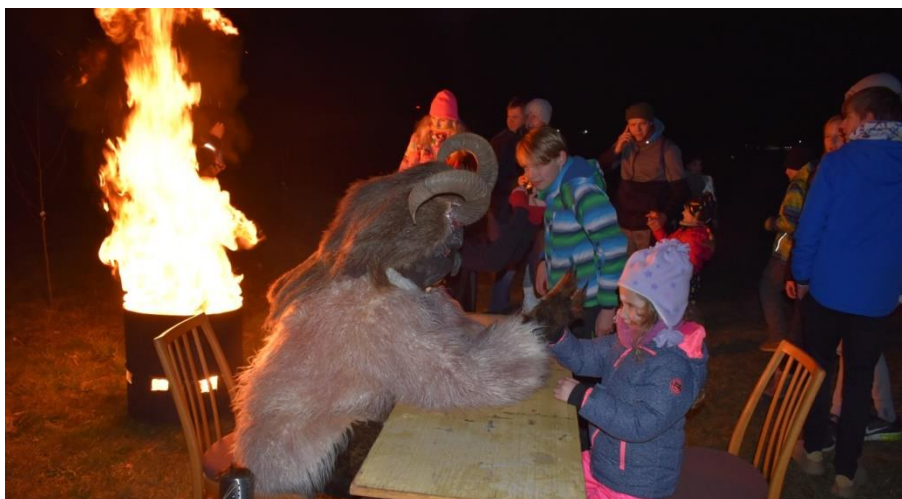
Obrázek 50: I malé děti se nezalekly a statečně čelily strašidelným čertům.

Závěrem bychom rádi poděkovali obci, bez jejíž bohaté nejen finanční podpory by nemohlo být