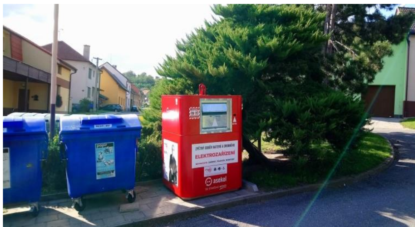
Obrázek 7: Červený kontejner na drobný elektroodpad u obchodu Na domečku.

zobrazující zařízení (např. TV), žárovky a samozřejmě žádný neelektroodpad. Kontejnery jsou provozovány ve spolupráci se společností Asekol. Další informace ohledně sběru elektroodpadu je tak možné se dozvědět na www.asekol.cz . Kontejnery a sběrná místa nejsou určeny ke sběru elektrozařízení, která se do kontejnerů nevejdou.