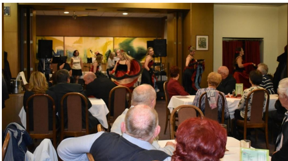
Obrázek 93: V druhé polovině vystoupila taneční skupina z Ivanovic na Hané, předvedla Offenbachův Cancan.

Stejně jako v minulém období činnost knihovny probíhala ve spolupráci se Čtenářským klubem Crhy a Strachoty v Pustiměři, dobrovolníky a spolupracujícími organizacemi.