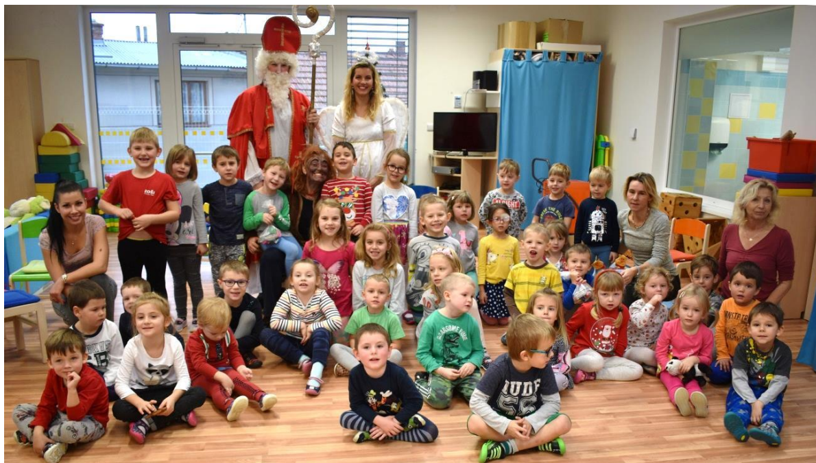
Obrázek 37: Za dětmi přišel čert, Mikuláš a anděl - nová budova.

Jako odměnu dostaly? Sladký balíček. Děkujeme našim hasičům a všem, kteří