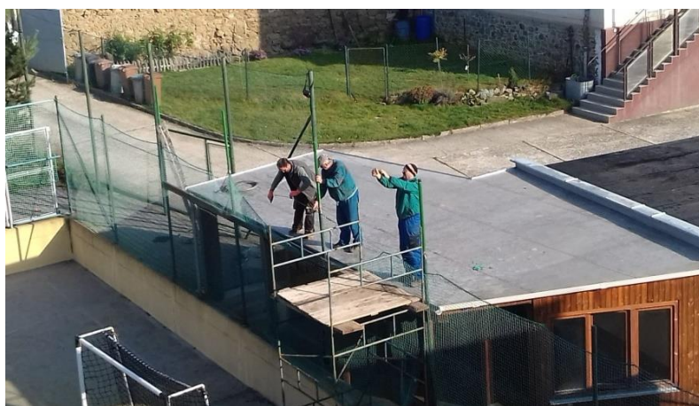
Obrázek 12: Pracovníci Obce opravují síť na hřišti za školou.

Únavou materiálu a také užíváním, doufejme, že ne vandalstvím, dochází k postupné degradaci sítě kolem hřiště za Sokolovnou. Pracovníci obecní čtyř tedy provedli pravidelnou údržbu tohoto areálu a poškozené síť alespoň částečně opravili. V části směrem k bytovému domu byla vybudována nástavba nad původní úroveň tak, aby bylo minimalizováno