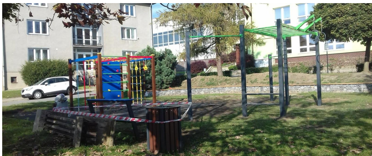
Obrázek 8: Nyní je povrch pod workoutovou sestavou upraven tak, aby se děti nebrodily blátem.

dlouhodobá funkce. Drobné úpravy prostoru budou