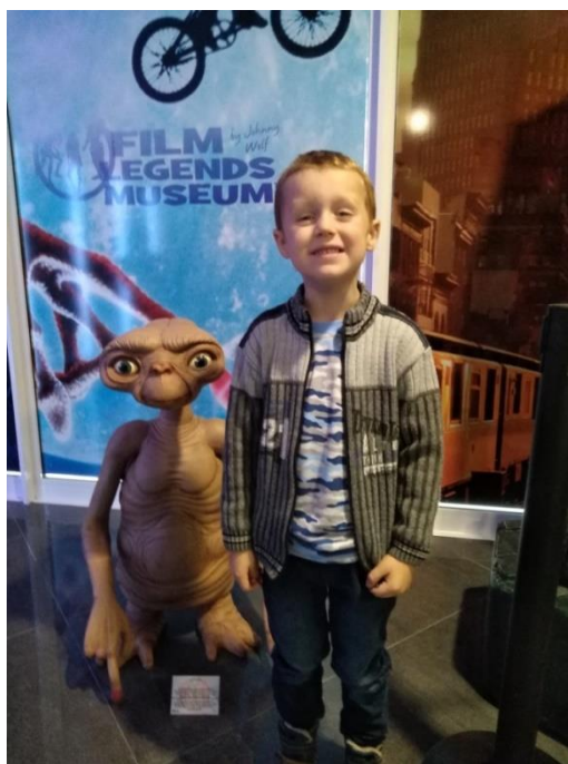
Obrázek 61: Jednou ze zastávek bylo Muzeum filmových legend.