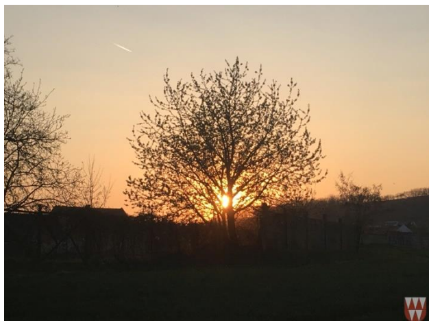
Obrázek 53: 1. místo. Foto: Monika Jelínková .