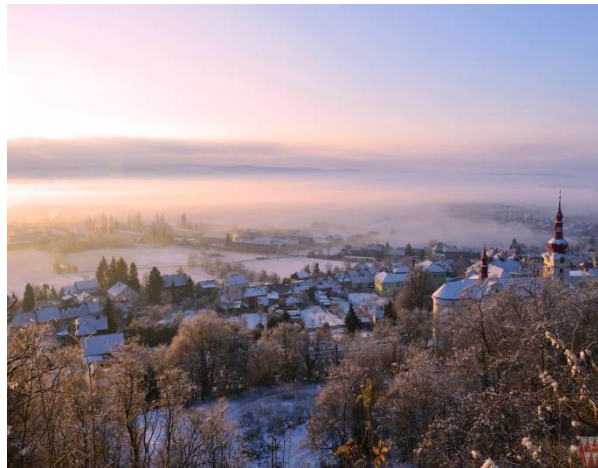
Obrázek 56: 2. Místo.

V letním období proběhl první ročník fotosoutěže „Vyfoť Pustiměř“ Soutěž byla vedena elektronicky a byla rozdělena do dvou částí. První část byla orientována na registraci fotek. Zaslát fotografii mohl kdokoliv, soutěže se tudíž mohli zúčastnit i sousedé z okolních obcí a měst. V druhé části, která probíhala celý srpen, byly fotografie zviditelněny na