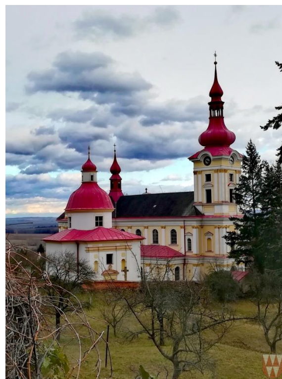
Obrázek 54: Cena kulturní komise Pustiměře.