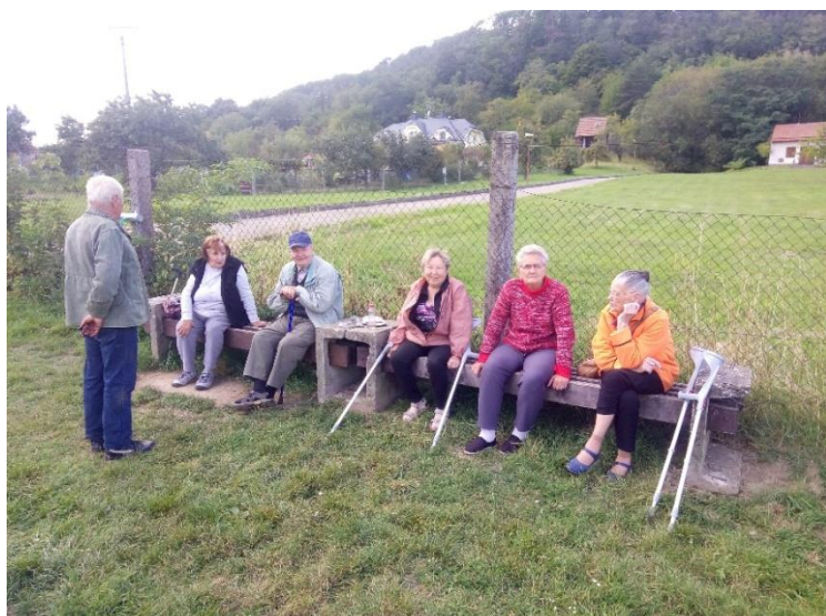
Obrázek 20: Z laviček u vinohradu je pěkný výhled do krajiny.

Díky návrhu místního spoluobčana se stává život pro naše seniory opět příjemnějším. Bylo jim nalezeno několik vhodných míst k setkávání, odpočinku,