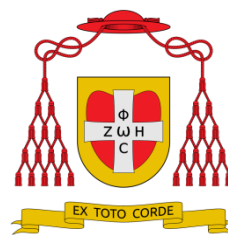
Obrázek 99: Kardinalní znak Tomáše kardinála Špidlíka, SJ.

V dubnu to mu bude už 10 let, co nás navždy opustil. Tomáš Josef kardinál Špidlík, SJ, čestný občan Pustiměře 3 „ Ex toto corde “ - „ Z celého srdce “ bylo heslem jeho životní pouti. Navzdory hlubokému vzdělání a spoustě zkušeností získaných na cestách po velké části světa si uchoval vřelé srdce, kterým obdarovával každého, s kým promlouval, či toho, kdo četl jeho knihy nejen duchovní.