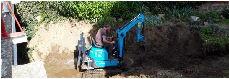
Obrázek 21: Obrázek 1: Čištění potoka.