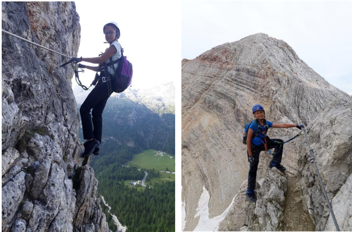
Obrázek 79: Říhovi na feratě Averalu v alpské oblasti dolomitů.

Ve druhé skupině se výjezdu účastnili sourozenci Brlohovi a Kajka Jelínková –