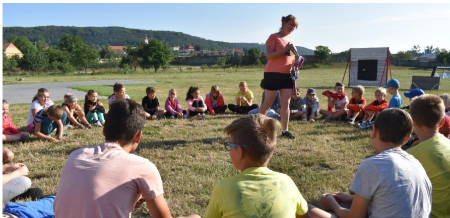
Obrázek 41: Děti si zahrály spoustu her.

Srpen jsme začali krásně, a to příměstským táborem za hasičkou. Tentokrát v duchu pustiměřského keltského osídlení. Hned první den jsme začali úvodem do historie, kdy nás paní Hrozová, jakožto nejstarší druidka kmene, seznámila s obyvateli, kteří v dávné době osidlovali pustiměřské (zelenohorské) hradisko. Dozvěděli