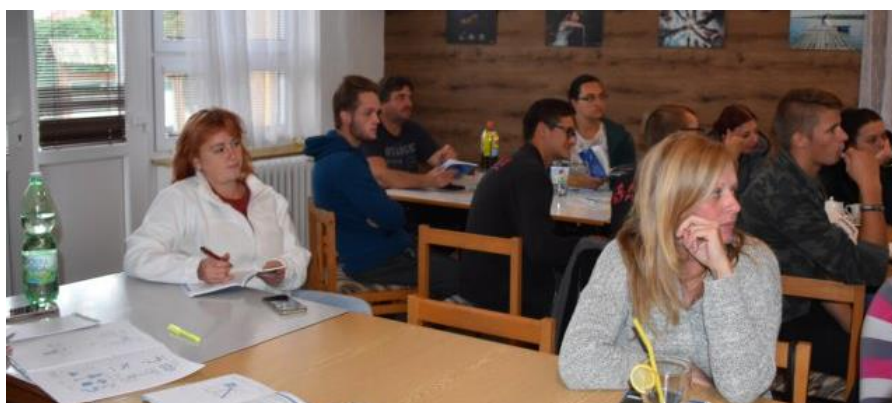
Obrázek 45: I pustiměřští hasiči se účastnili vzdělávání pracovníků s mládeží v Pustiměři.