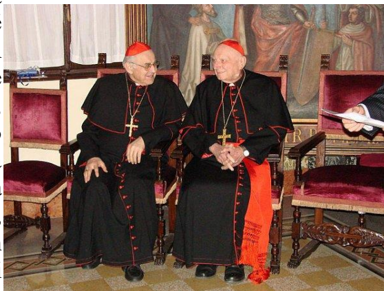
Obrázek 101: Kardinál Miloslav Vlk s Tomášem kardinálem Špidlíkem, SJ. Zdroj: https://brnensky.denik.cz/serialy/tomas-spidlík-kardinal-ktery-se-nejvic-smal.html

Ve dnech 6. - 7. srpna 2005 Jeho eminence Tomáš kardinál Špidlík 4 přijal čestné občanství v Pustiměři. A jak viděl svůj vztah k naší vesnici? Nejlépe nám odpoví on sám: „Ráno jsem uvažoval, co to asi znamená občanství? Od obcování - mít styk. Obvykle se scházejí lidé, kteří mají spolu něco společného. Tak např. pekaři, umělci a jiní. Občanství to bývají lidé, kteří jsou narozeni na stejném místě, anebo dlouho a dlouho bydlí. Však víte, že za starých časů, když někdo přišel nový, tak se jmenoval Novák. A často bylo hned poznat na řeči, z jaké vesnice pochází. V dnešní době se miliony a miliony lidí ve světě přesazují. A já už jsem toho světa také pochodil velice mnoho. Od Austrálie do Afriky, do Ameriky, atd. A v Itálii se mě ptají: jste ještě Čech nebo už jste Ital? ... narodil jsem se na Moravě a pak jsem přijel do jiných zemí a do Itálie, a říkám: cizina, Itálie, mě neodcizila. Naopak, dokončila to, co jsem doma začal. A já jsem vděčný jak Moravě, tak Itálii. Obojí mi prospívalo. Vždycky tam z toho domova něco zůstane. ... A co já jsem si tu zachoval? Stále nějakou činnost. Kdy jsem