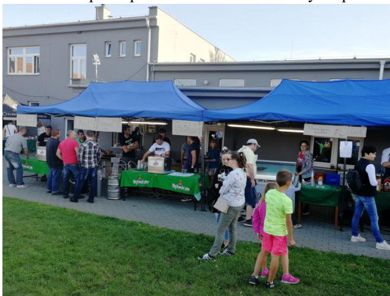
Obrázek 51: Pivní festák.

Akci zorganizovala naše kulturní komise. Vše za velké podpory Obce. Za tuto chceme poděkovat.