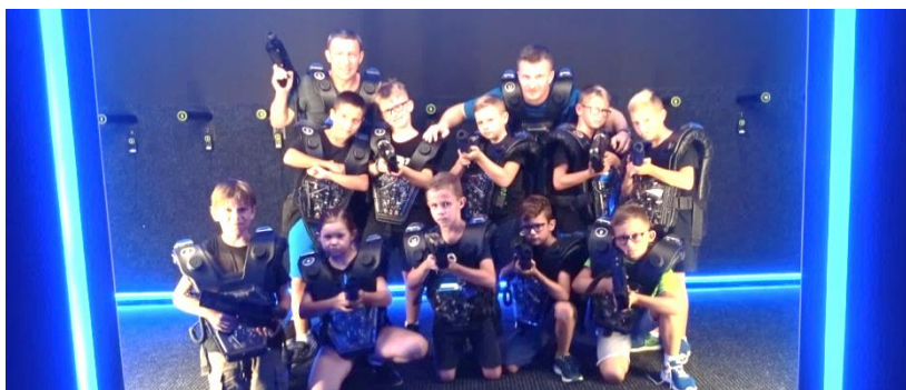
Obrázek 83: Laser game, fotbal kemp léto 2019.

Starší přípravka zahájila sezónu 2019/2020 již uprostřed prázdnin fotbalovým kempem. Hráči denně pilně trénovali i přes vysoké letní teploty. Tým absolvoval i několik přípravných utkání s mužstvy