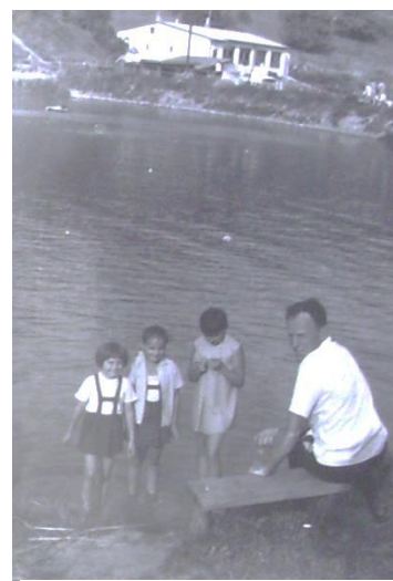
Obrázek 98: Posezení u vody bylo příjemnou relaxací. Škoda, že je jen minulostí.

Zastánci minulé doby začali argumentovat tím, co všechno se v obci vybuďovalo. Nakonec se debata stočila