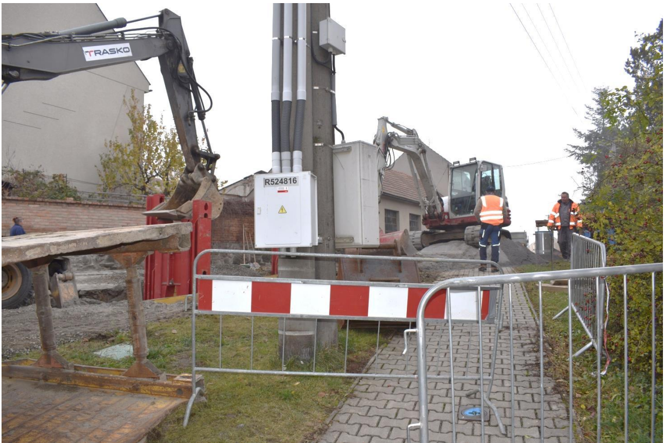
Oprava kanalizace v Pustiměři u Krátkého.