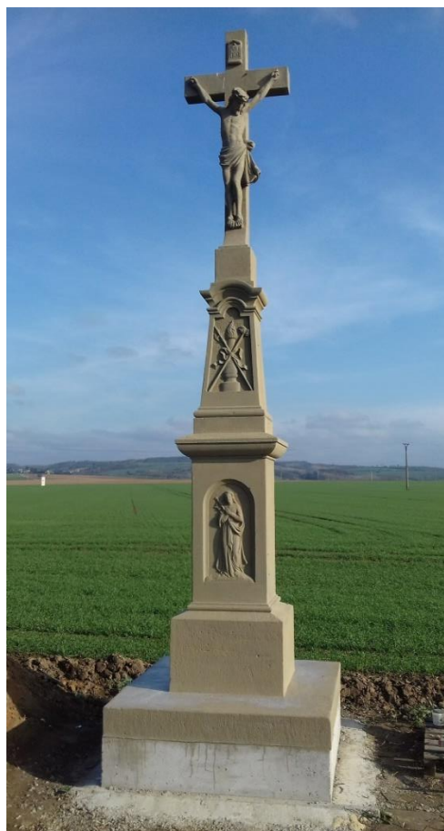
Obrázek 19: Zrestaurovaný kříž na Podsedkách.