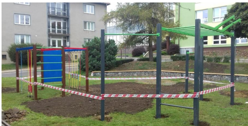
Obrázek 9: Na dětské hřiště byla nainstalována lavička a nové prvky pro sportování dětí.

Veřejný prostor pod základní školou, který v minulosti sloužil jako dětské