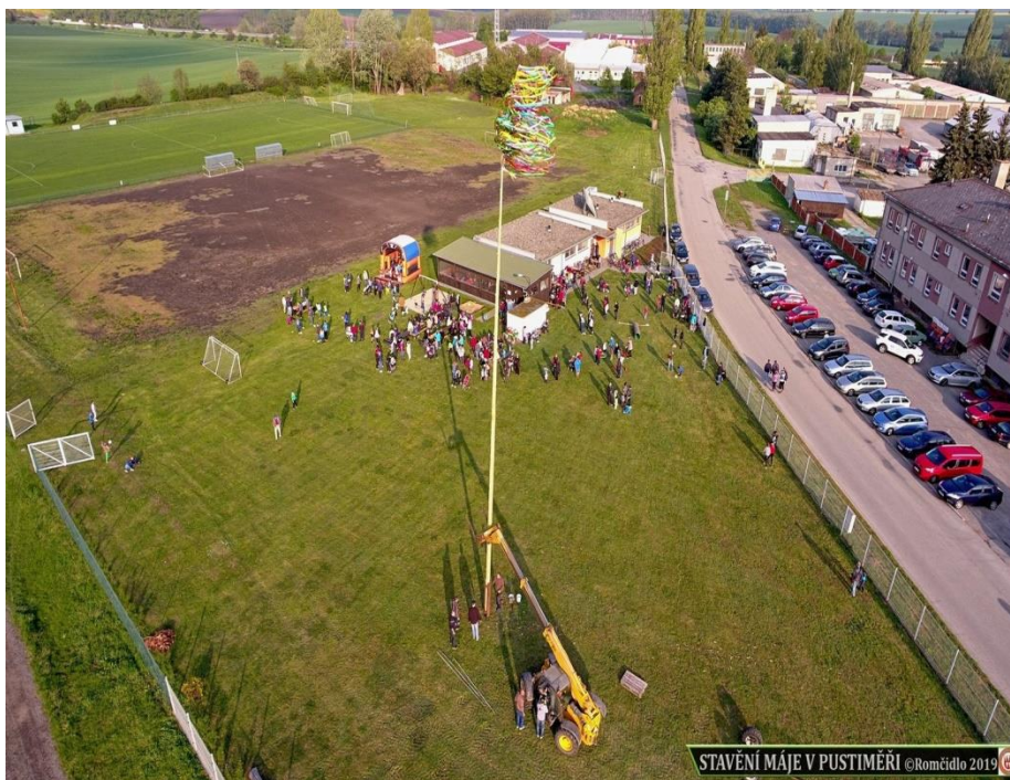
Obrázek 24: Stavění máje. Dronem pořízený obrázek.

Naše komise se podílela na organizaci několika událostí. Jsme propojeni napříč jednotlivými