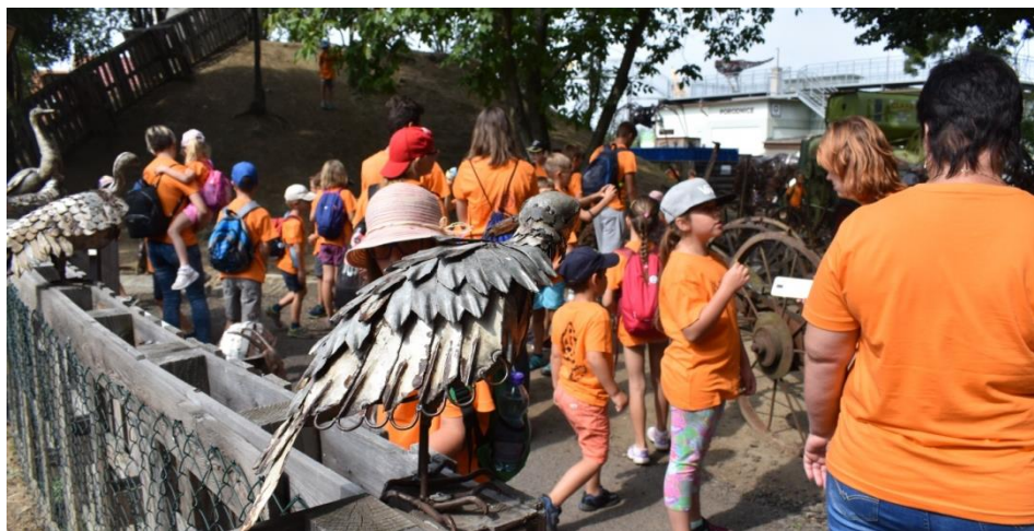
Obrázek 44: Ve vlastnoručně nabarvených tričkách byli děti na výletě v Kovo-zoo ve Starém Městě.

Touto návštěvou však náš výletní maraton neskončil. Vedle skanzenu se totiž nachází Živá voda – nádherný areál s přírodním koupalištěm a obrovským sladkovodním podzemním akváriem. Tam jsme prostě