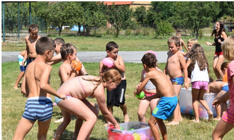
Obrázek 42: Balonková bitva: Foto: Zuzana Štroblíková.

Druhý den jsme se vydali na celodenní výlet do KovoZoo ve Starém Městě. Byla to krásná a poučná podívaná. Zjistili jsme, že i ze šrotu se při dobré vůli dá vyrobit mnoho nových a zajímavých věcí. Užili jsme si labyrint ze starých pneumatik,