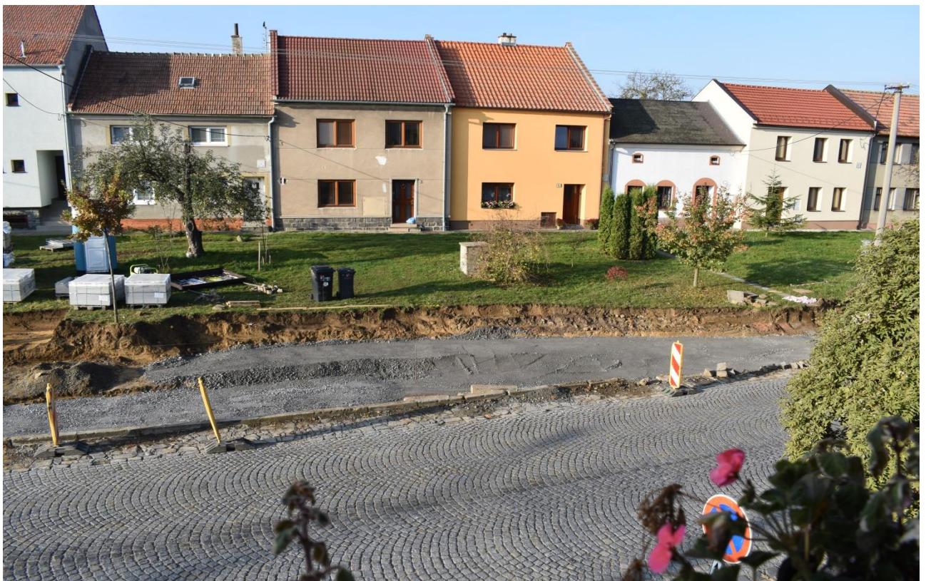
Výstavba zastávky U kříže.