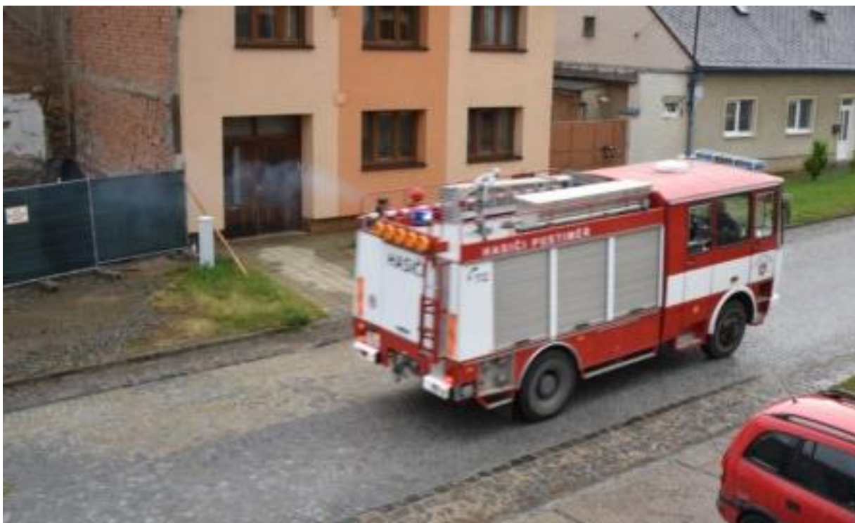
Naši hasiči ujížděli zasáhnout k nehodě a pádu větve chráněné lípy u Kalvárie na křižovatce u Perželového.