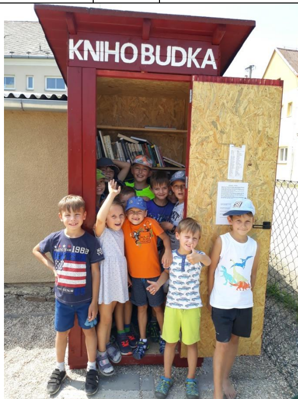
Obrázek 86: Také se trošku vzdělali v místní "Knihobudce"...