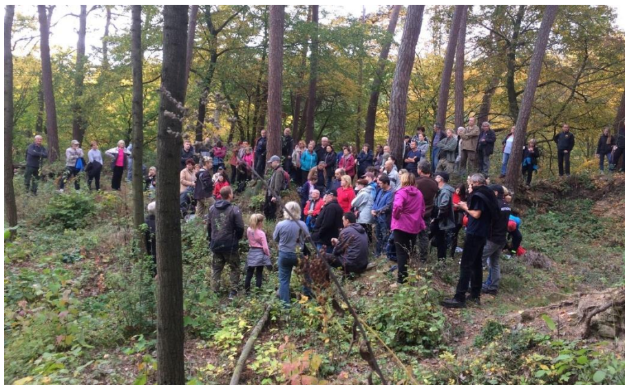
Obrázek 70: Na výlet se dostavilo více než 150 lidí.

Fotografie z akce jsou k dispozici ve fotogalerii místní knihovny: