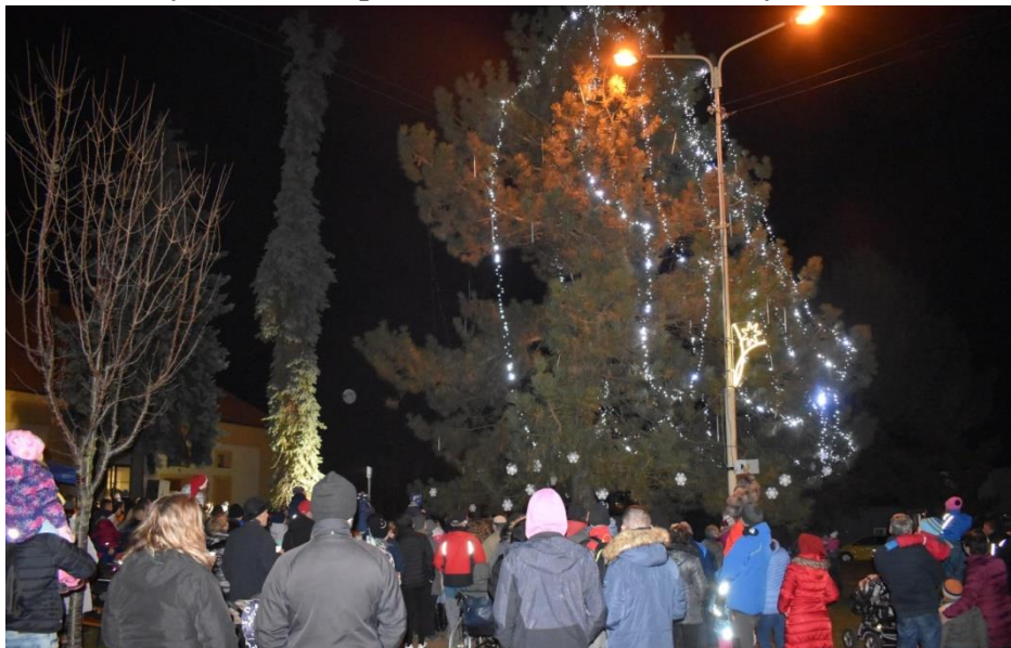
Obrázek 64: Účast byla hojná.

vánoční dny. Prodejci nabízeli široký sortiment zboží od laskomin až po dekorace z různých materiálů, čímž se zavděčili snad každému návštěvníkovi. Děti si v dílničkách vytvořily vánoční věneček a šumivou kouli do koupele. V zinním fotokoutku byla možnost vyfotit se na památku na tuto akci. Celým svátečním odpolednem nás opět