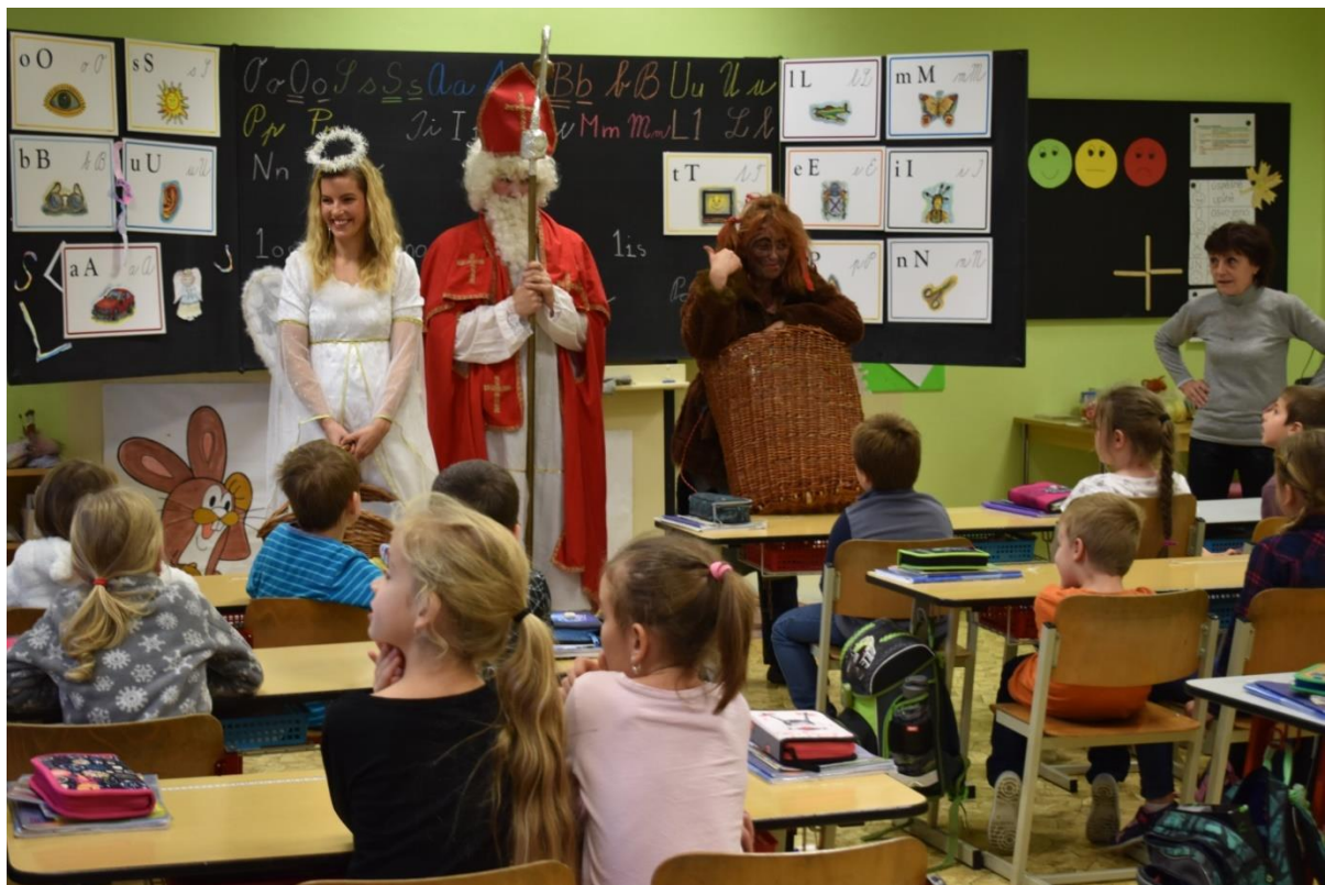
Čert četl se rozhlížel, koho by vzal do koše, anděl rozdával dárečky, Mikuláš na vše bedlivě dohlížel a paní učitelka hlídala, aby se jí přece jen žádné dítě neztratilo ...