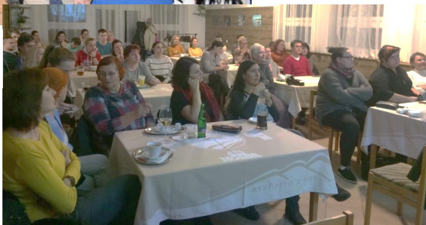
Obrázek 29: Účast předčila očekávání.