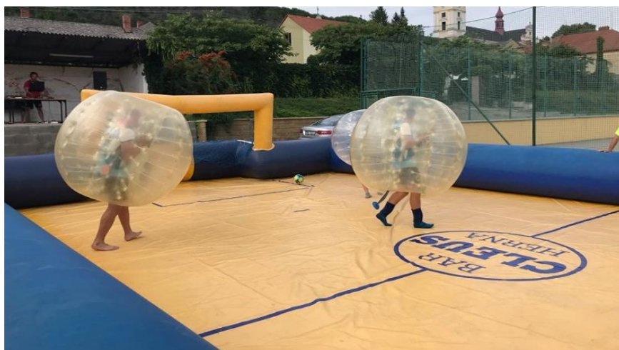
Obrázek 59: Bumperbally s arénou.

V sobotu 7. prosince 2019 od 19:00 se Freekulin spojil s místní kapelou Jednou týdně při pořádání tradičního vánočního večírku v novém kabátě pod názvem „AKCA, JAK SVIŇA“. Kromě skupiny „Jednou