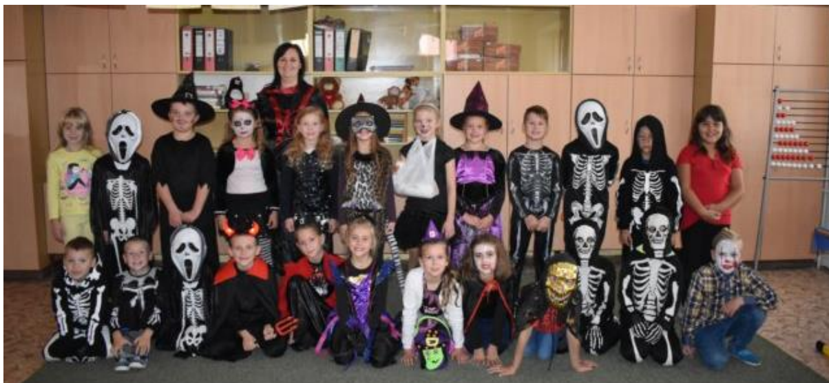
Obrázek 33: Kouzelné postavy 2. třídy naší ZŠ.