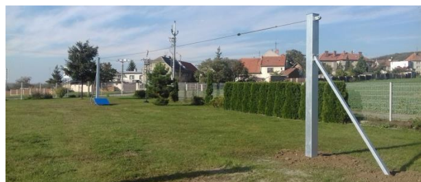
Obrázek 11: Lanová dráha na fotbalovém hřišti.