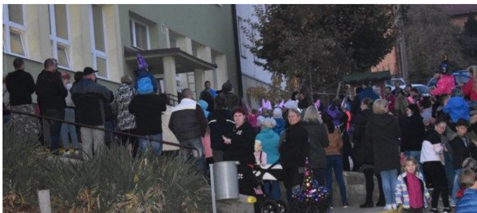
Obrázek 35: Představení našich dětí si přišlo zhlédnout a poslechnout spoustu jejich rodičů a prarodičů.

Od rána panovala ve škole strašidelná atmosféra. Nejen, že se prostory školy postupně proměňovaly v jedovou chýši čarodějnice, ale na chodbách jsme mohli potkávat žáky v nápaditých maskách a kostýmech, kteří byli často k nepoznání. Dopoledne, kdy jsme dlabali dýně na večerní rozsvěcení, nám svým vystoupením zpříjemnila hudební skupina Marbo.