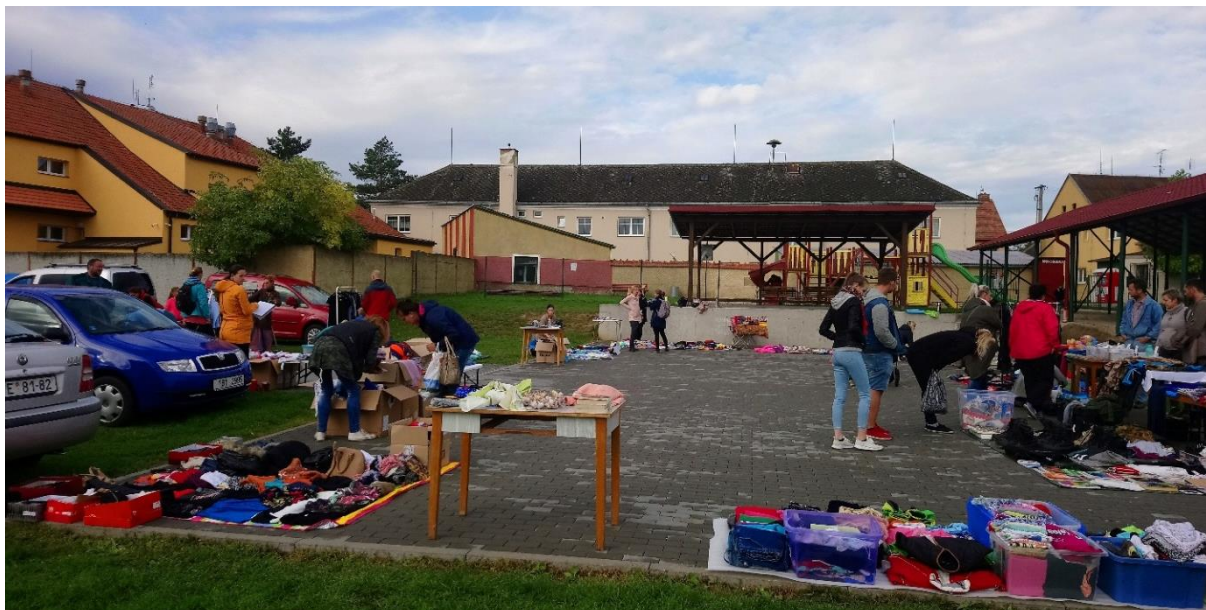
Obrázek 60: Prodejců se sešlo kolem 20.

Dne 28. 9. 2019 se od 9:00 do 12:00 hod. za hasičskou zbrojnicí pořádal bleší trh. Mohli jste přijít prodávat i nakoupit zboží různého druhu. Nejvíce se prodávalo dětské oblečení, hračky, potřeby pro domácnost a další. Prodejců se sešlo kolem dvaceti. Prodeje a nákupu se zúčastnili nejen místní obyvatelé, ale také lidé z okolních vesnic. Součástí akce bylo i občerstvení.