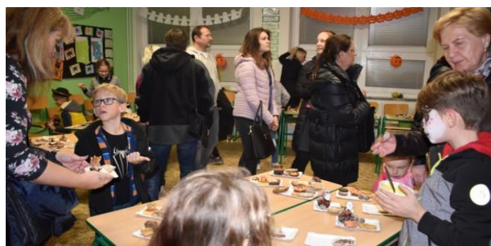
Obrázek 32: Po zábavném programu žáků nás čekalo občerstvení ve strašidelně vyzdobené škole. Foto: Anna Hrozová.

V pátek 25. října se na naší základní škole uskutečnil tradiční Den kouzel. Celé akci předcházely několikátýdenní přípravy výzdoby, která byla tentokrát v čarodějnickém