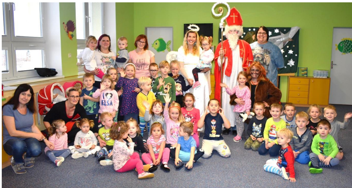
Obrázek 36: Za dětmi přišel čert, Mikuláš a anděl - stará budova.

Stalo se to ve čtvrtek 5. 12. 2019. Za dětmi do naší MŠ přišel Mikuláš, čert a anděl.