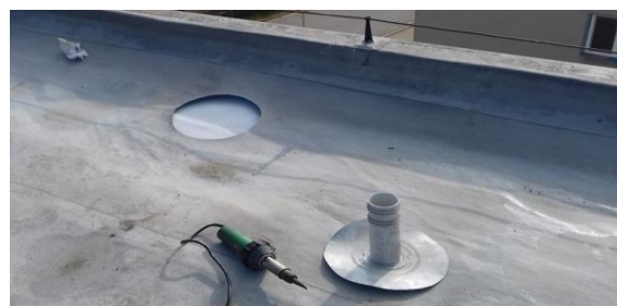
Obrázek 14: Poškozená místa krytiny byla nahrazena.