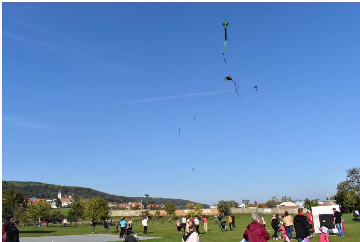
Obrázek 49: Drakiáda 2019.

Za závodem požárnické všestrannosti jsme se museli 12. října 2019 rozjet tentokrát až do Bošovic u Brna. Naše družstva se utkala ve štafetě požárních dvojic a změřila síly ve zdravotvědě, střelbě ze vzduchovky, topografii a hasičské teorii. Tímto závodem jsme pro letošek zakončili venkovní zápolení, které začne opět v dubnu 2020. To však neznamená, že máme s dětmi prázdniny. V listopadu, prosinci a lednu probíhají v okrese soutěže v uzlování, které – pokud chceme uspět v celoroční soutěži