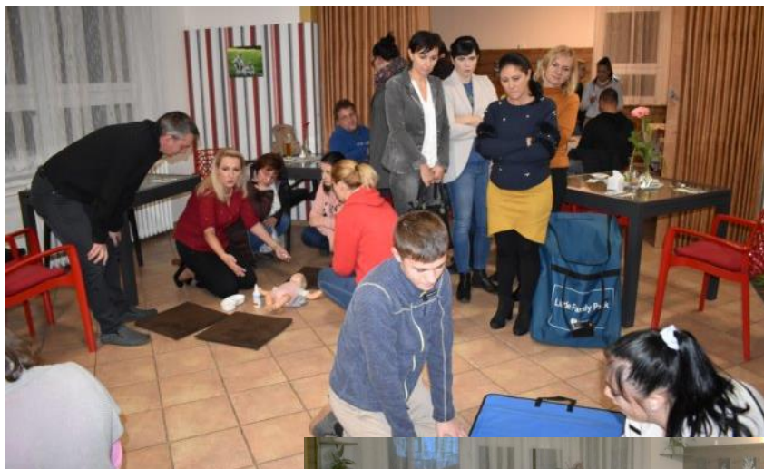
Obrázek 28: Zámci si vyzkoušeli prakticky, jak takovou pomoc poskytnout.