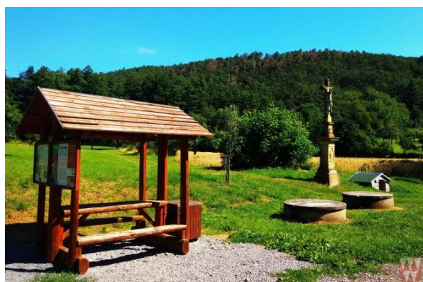
Obrázek 55: 3. místo.

V letním období proběhl první ročník fotosoutěže „Vyfoť Pustiměř“ Soutěž byla vedena elektronicky a byla rozdělena do dvou částí. První část byla orientována na registraci fotek. Zaslát fotografii mohl kdokoliv, soutěže se tudíž mohli zúčastnit i sousedé z okolních obcí a měst. V druhé části, která probíhala celý srpen, byly fotografie zviditelněny na