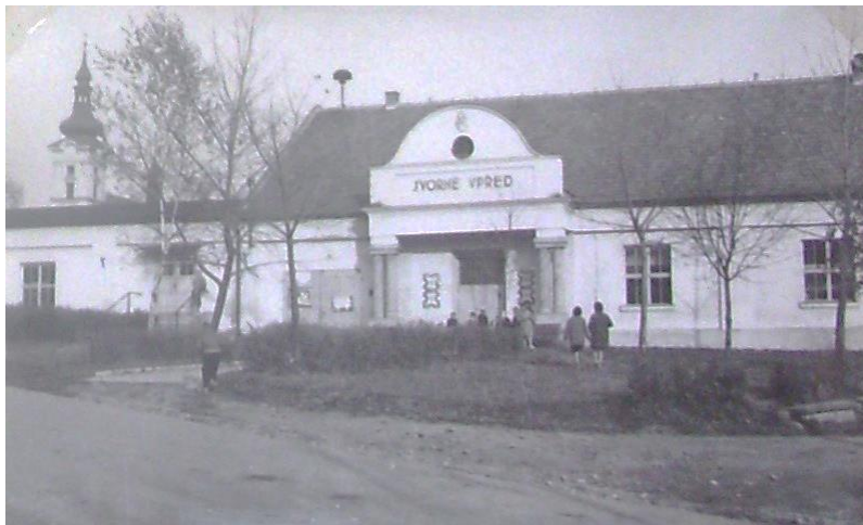
Obrázek 96: Sokolovna, před níž byla první schůzka studentů s občany v prosinci 1989.

V naší obci, tak jako všude, občané sledovali s napětím dění v Praze. Rezolutně