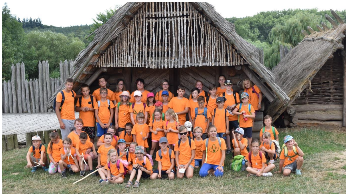
Obrázek 43: ve skanzenu Modrá.

nemohli zastavit. A tak jsme se domů vrátili až navečer a řádně zmordovaní, ale