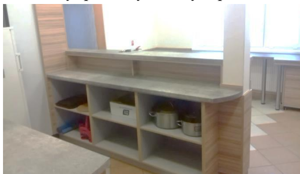
Obrázek 16: V nové kuchyňce se pracovní prostor přehledně rozdělil na několik vzájemně oddělených míst, a tak si obsluhující nebudou překážet.

bezpečný provoz. Z uvedeného důvodu jsme nechali nainstalovat novou kuchyň, ve které, jak věříme, se budou cítit dobře jak obsluhující, tak i zákazníci. Práce provedl pan Dušan Barát.