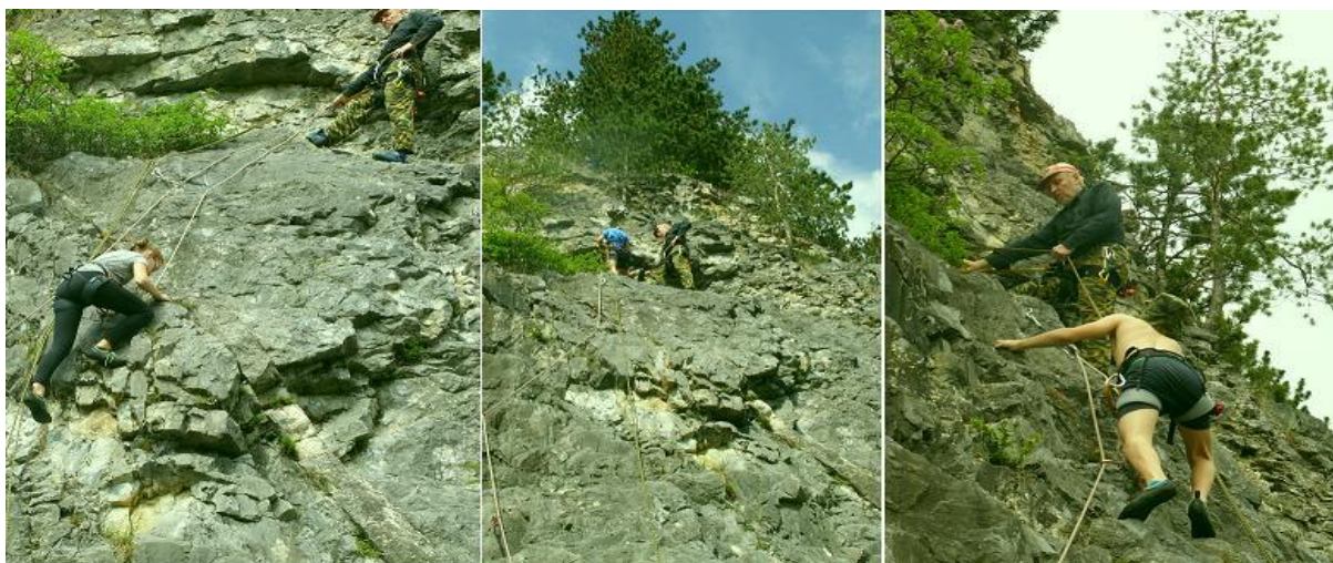
Obrázek 75: