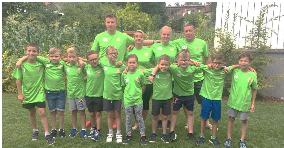
Obrázek 82: fotbalový kemp léto 2019 - nahoře zleva: Trenér. Fyzioterapeutka. Tisková mluvčí. Top manažer.