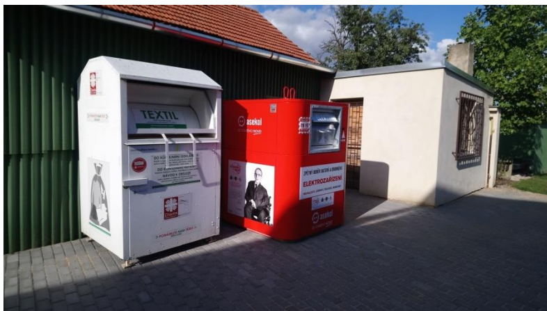
Obrázek 6: Červený kontejner na drobný elektroodpad ve dvoře obecního úřadu.

Na sběrných místech za obecním úřadem a u obchodu Na Domečku byly nově umístěny kontejnery na sběr drobného elektrozařízení. Do těchto nádob nepatří