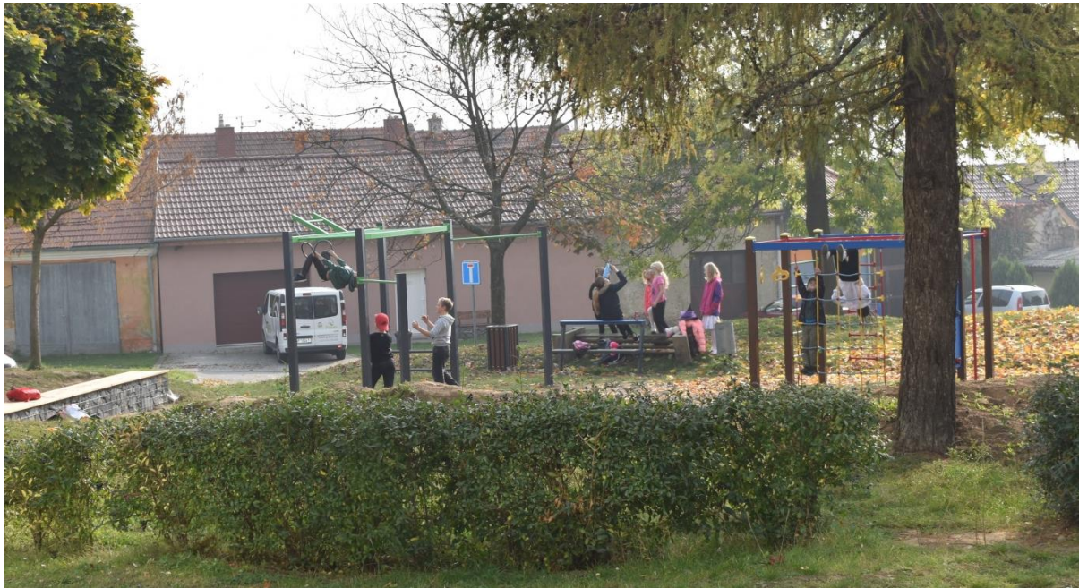
Na hřiště pod školu míří děti každou volnou chvílí.