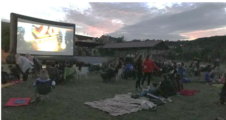
Obrázek 26: Návštěvníci se začali scházet ještě za světla.

V pátek 5. 7. 2019 se poprvé po desítkách let v naší obci uskutečnilo promítání letního kina. Diváci měli možnost v areálu za hasičkou zhlédnout v současnosti velmi populární hudební film Bohemian Rhapsody. Areál byl veřejnosti otevřen již od 20. hodiny, kdy byla možnost obsadit vhodná strategická místa a zakoupit si