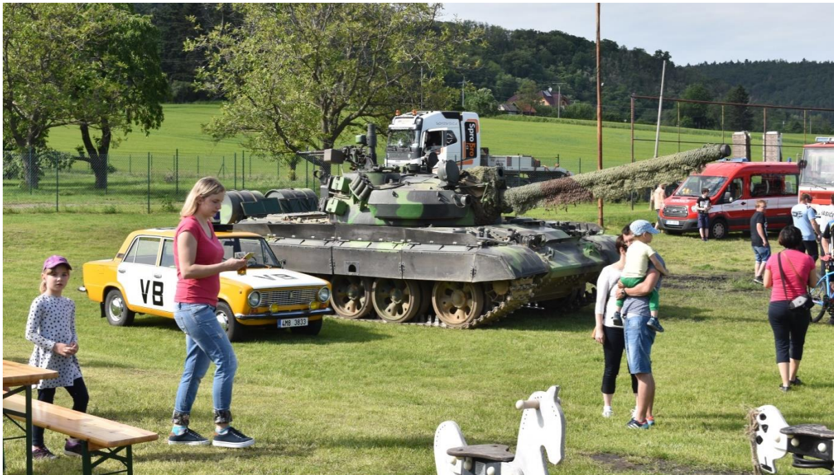
Obrázek 25: Při kácení mája jsme si mohli prohlédnout několik vojenských a hasičských vozidel.

Pro ty větší pak byly připraveny jiné atrakce. Proběhla tombola již s tradičními cenami. Točilo se pivo, na grilu se usmíval vepřový steak. Nechyběly tradiční