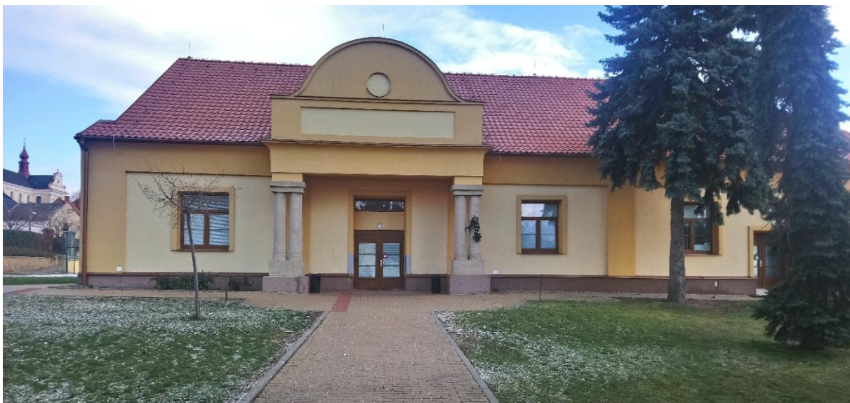
Obrázek 66: První číslo pustiměřského adventního kalendáře se objevilo na Sokolovně při rozsvícení vánočního stromu.

Při procházkách spojených s užíváním si sváteční atmosféry, se můžete od 1. 12. 2019 zúčastnit vánoční zábavy "adventní kalendář v Pustiměři". Náplní akce je hledání všech čísel adventního kalendáře od 1 do 24. Čísla budou rozmístěna