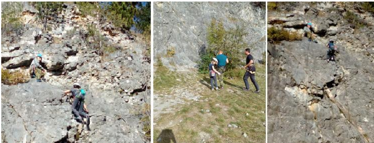
Obrázek 78:

proškolit i rodiče dětí. Ti se rádi a úspěšně zapojili do činnosti oddílu, za což je jim třeba poděkovat. Tak si totiž všichni dokonale zalezou, aniž by museli čekat, jak je tomu mnohde jinde.