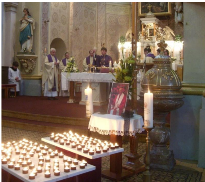
Obrázek 102: Zádušní mše při příležitosti úmrtí Tomáše kardinála Špidlíka, SJ v Pustiměři.