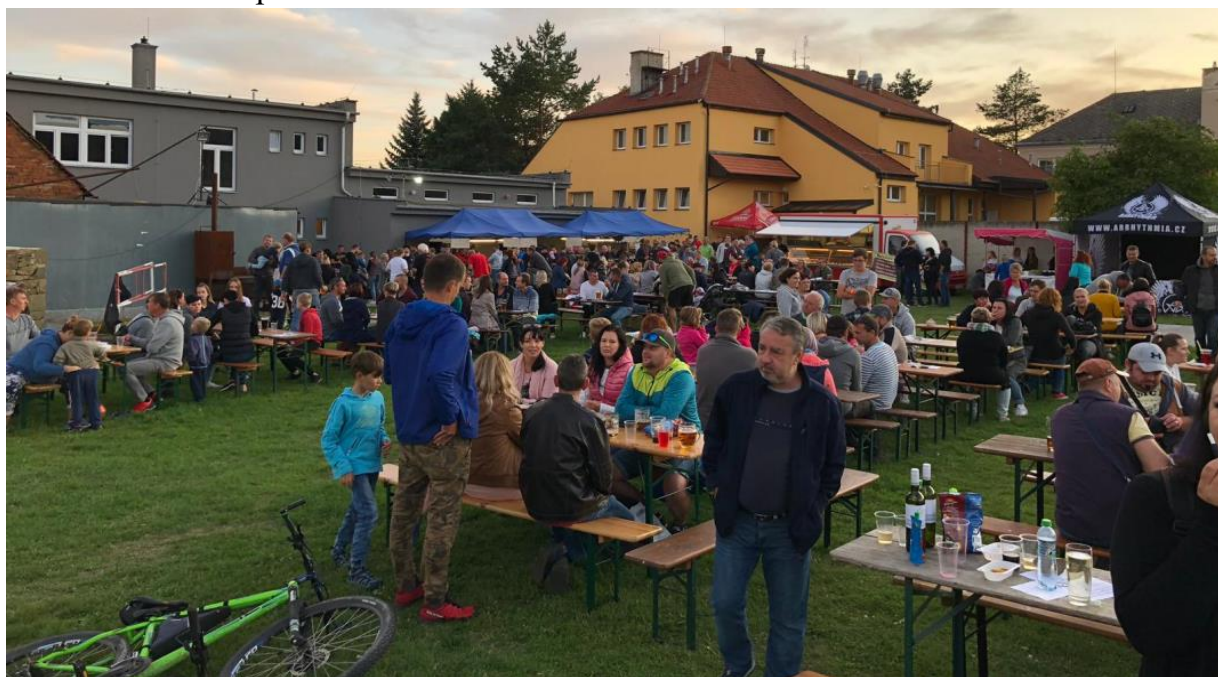
Obrázek 52: Pivní festák.

Vážíme si důvěry, kterou do nás Obec vložila. Věřím, že jsme nezklamali.