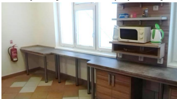
Obrázek 15.: V nové kuchyňce vzniklo mnoho nových úložných prostor a odkladových ploch.

Před mnoha lety byla provedena rozsáhlá rekonstrukce budovy Sokolovny včetně interiérů. Na co se v této souvislosti zapomnělo, byla úprava výčepu a souvisejících prostor tak, aby byl zabezpečen bezvadný, pohodný, útulný a především