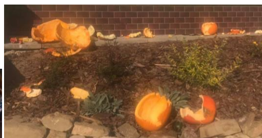
Obrázek 34: Škoda jen, že nevydržely školu zdobit ani jeden den. Zdroj: Facebook Hany Suché. Více viz tamtéž.

V pátek 25. října se na naší základní škole uskutečnil tradiční Den kouzel. Celé akci předcházely několikátýdenní přípravy výzdoby, která byla tentokrát v čarodějnickém