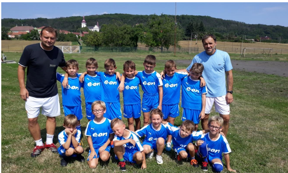
Obrázek 85: Tým mladší přípravky na jednodenním fotbalovém soustředění v srpnu 2019.

Tým mladší přípravky má za sebou premiérový vstup do soutěžních utkání. Po ročním trénování se tým mladší přípravky představil v soutěžních utkáních