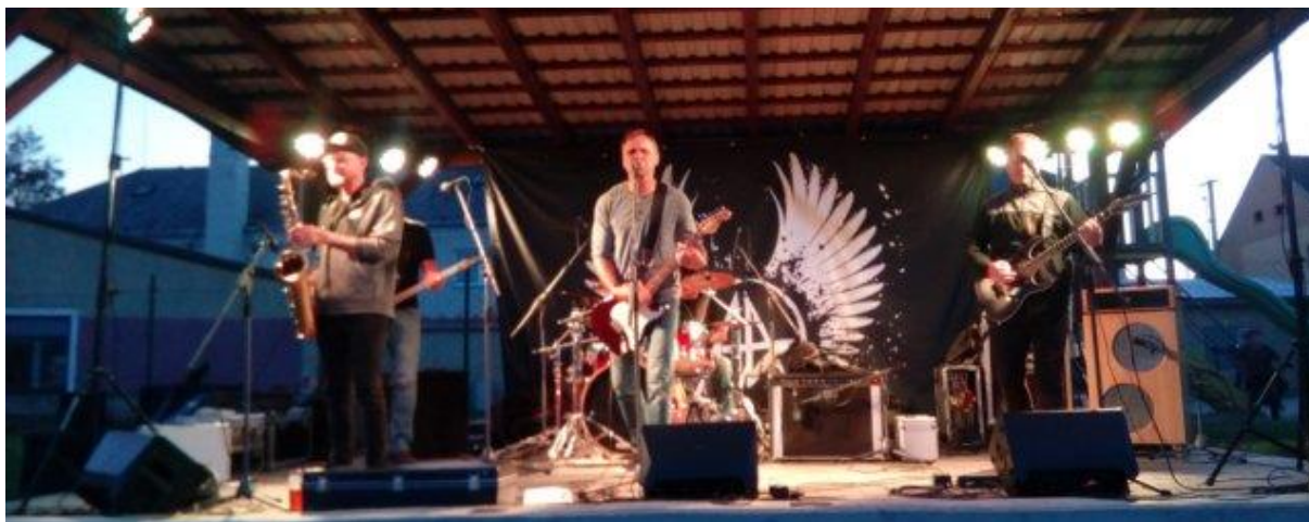
Obrázek 46: Na Pivním festivalu vystoupila i pustiměřská skupina "Jednou týdně".

Večerní soutěže se zúčastnilo asi 150 dětí. Družstva bojovala statečně a naši mladší si odnesli 3. a 6. místo. Starší zabojovali ten den ještě o něco lépe a dosáhli na 1. a 2. místo. Děkujeme tímto jejich trenérům Michalu Vrbovi a Lukáši Blažkovi za obětavou práci, bez níž by těchto úspěchů nedosáhli.