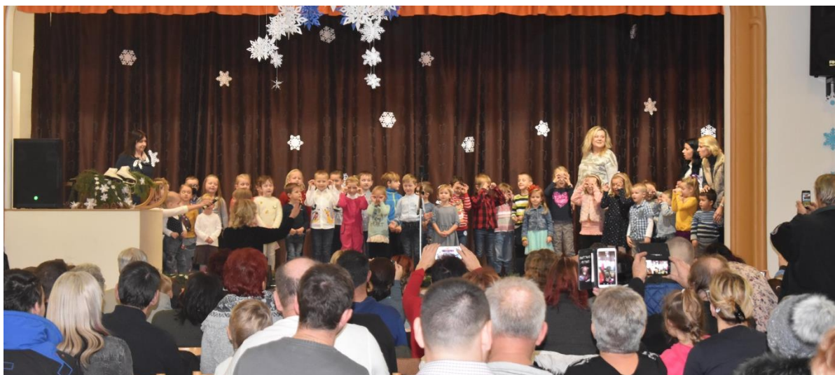
Obrázek 63: Následovalo pásmo básniček a písniček v podání dětí z mateřské školky.

První adventní neděli se v naší obci konalo Rozsvícení vánočního stromu a 3.