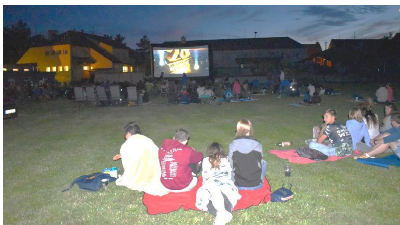
Obrázek 27: Letní kino Bohemian Rhapsody přilákalo spoustu milovníků filmu za hasičskou zbrojnicí. Pohled na celé hřiště.

Velké poděkování patří Zuzaně Štroblíkové, která celou akci zajišťovala (občerstvení i promítání) a všem, kteří jí pomáhali.