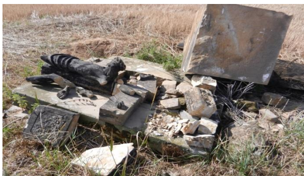
Obrázek 18: Zničený kříž na Podsedkách.

Následkem podnorování základů, vlivem času a únavou materiálu došlo k pádu a totální destrukci kříže v poli nacházejícího se po pravé straně státní silnice směrem na Vyškov.