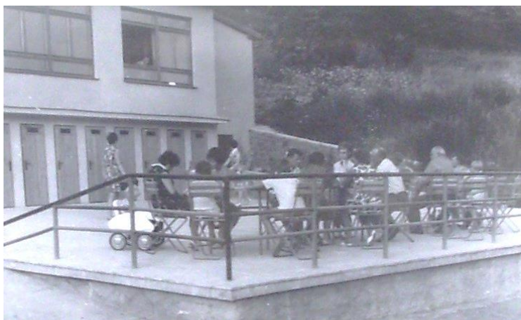
Obrázek 97: Restaurace Na Hradisku lákala k příjemnému posezení.

k areálu, který byl vybudován v akci „Z“. „Práce na výstavbě areálu se účastnili občané naší vesnice. Do restaurace Na Hradisko chodili lidi. Byla to zastávka na nedělních vycházkách. Víkendové večery při sklence vína a vynikajícím tatarským bifteku zde byly velice oblíbené. Obsluhoval tam pan Němec, který to zařízení velice dobře vedl. Ze strany některých zástupců Místního národního výboru se ale objevovaly nové a nové požadavky, které byly příčinou toho, že pan Němec restauraci nakonec opustil. Od té doby celé zařízení jen chátralo a chátralo.“ připomněl všem pan Všetula. „Lidé začali souhlasně tleskat.“ dodal, „Je to zneuctění práce, kterou do tohoto zařízení vložili občané nejen Pustiměře, ale i nejbližších vesnic.“