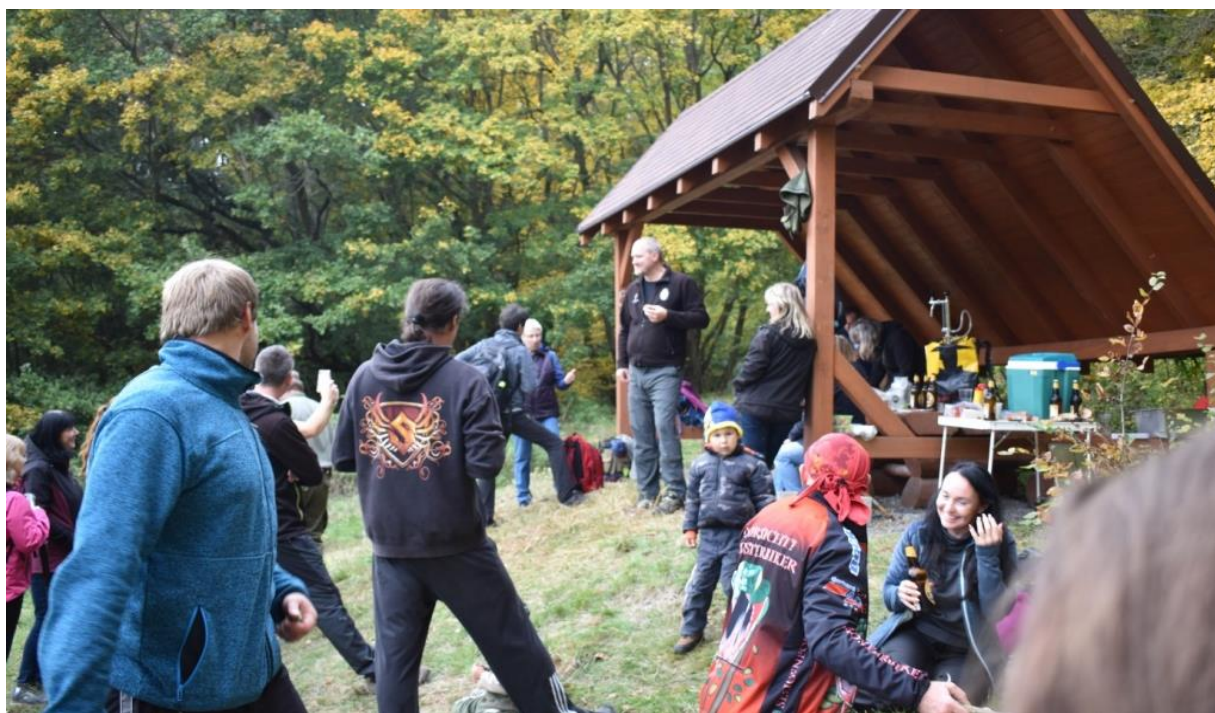
Obrázek 71: Na občerstvení si výletníci pochutnali.

Zájemci o historii, kteří propásli tuto archeologickou výpravu, mohli navštívit přednášku o hradu Melice, kterou rovněž pořádalo Muzeum Vyškovska, tentokrát ve svých prostorách ve středu 30. 10. 2019 od 17 hod ve výstavním