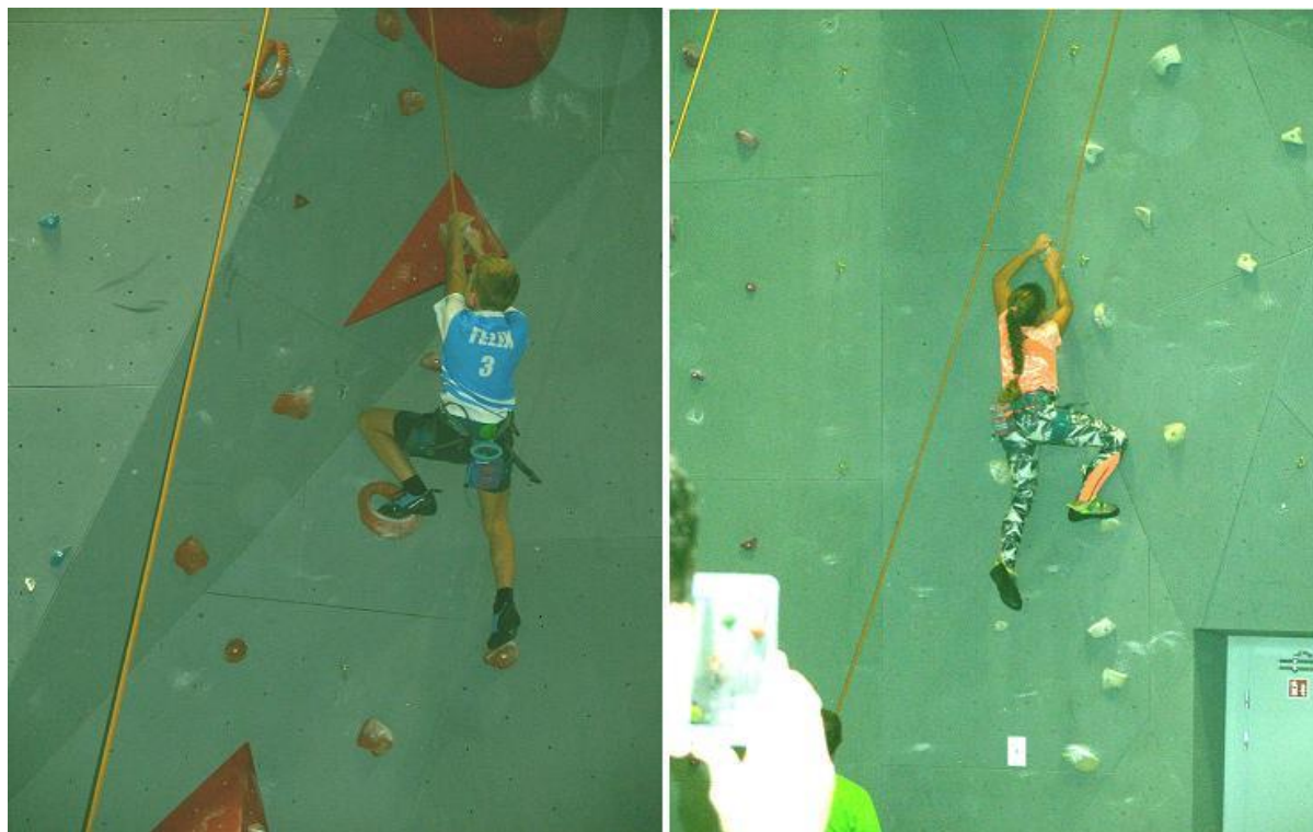
Obrázek 77: : Na lezecké stěně v pustiměrské Sokolovně.

Nedílnou součástí výcviku je seznamování dětí se základním horolezeckým materiálem. Ti malí jej musí umět rozpoznávat, ti starší pak i dokonale používat a to i