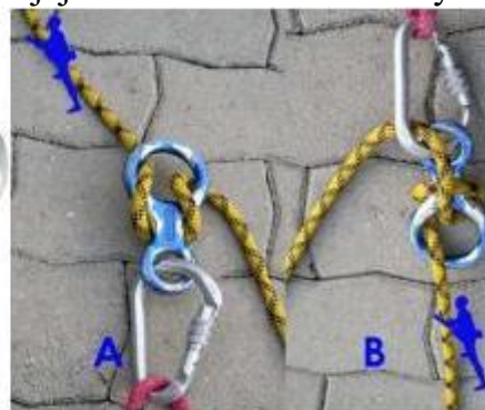
Obrázek 76: