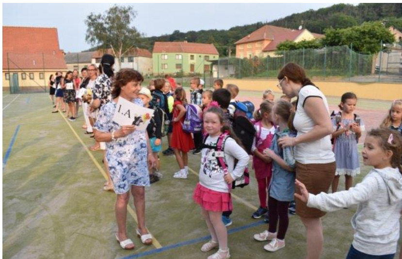
Obrázek 30: Nejvíce 1. září 2019 se do školy těšili prvňáčci.