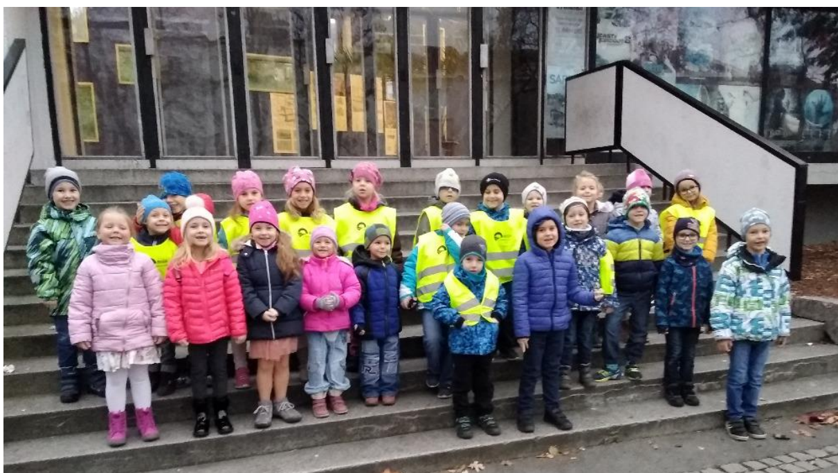
Obrázek 40: Předškoláčci před divadlem v Prostějově.