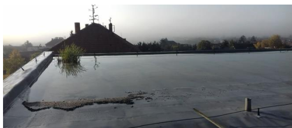
Obrázek 13: Na střeše tělocvičny se uchytila vegetace.

Na základě upozornění všímavých spoluobčanů na rostoucí vegetaci na střeše