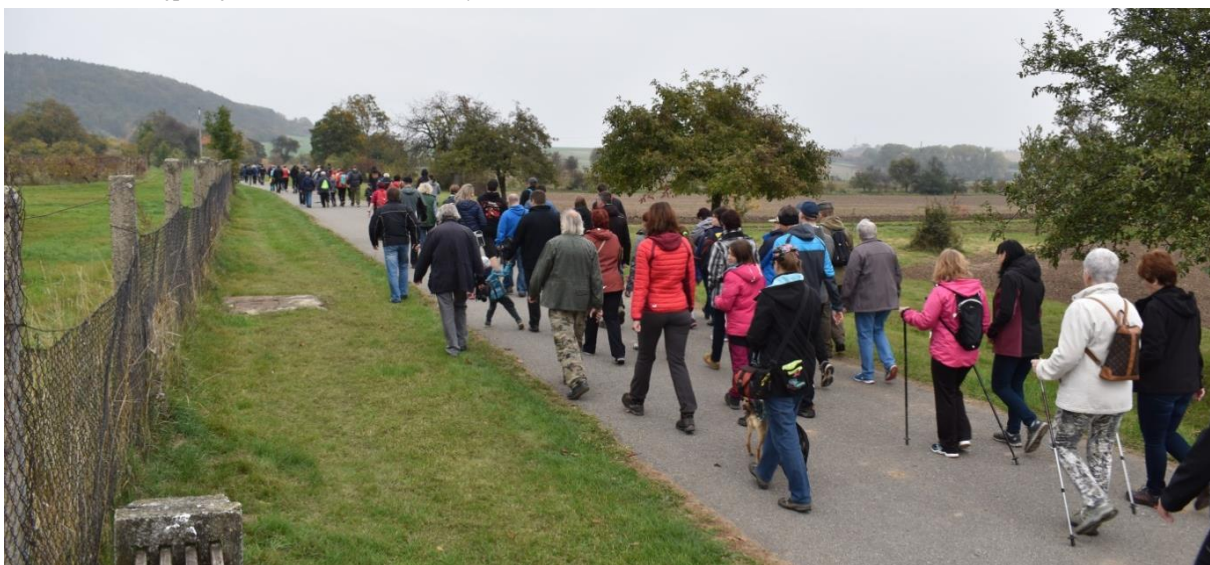
Obrázek 69: Akce se zúčastnilo více jak 150 lidí všech věkových kategorií.

Janem VII. Volkem. Historie hradu byla velice krátká. Jako významný církevní majetek se stal terčem husitů, kteří ho v r. 1423 dobyli. Hrad zpustl a nikdy již nebyl obnoven.