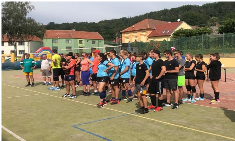
Obrázek 57: Přihlásilo se 5 týmů.

cornhole, maxi jenga, maxi mikádo, mini ping pong, curling. Za vstupné na všechny atrakce dohromady v hodnotě pouhých 100,- Kč. Za tyto peníze mohlo dítě nebo dospělý využívat po celý den jakoukoliv z nich nebo třeba i odejít a vrátit se. Vítán byl