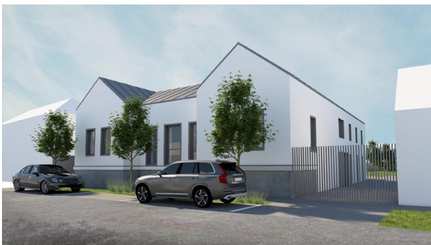
Obrázek 17: Jedna z možných podob vzhledu budovy po rekonstrukci.

V minulém roce se z prostor dnes již bývalé mateřské školy odstěhovali poslední žáci. Obec Pustiměř tak stála před rozhodnutím, co nadále s touto budovou. Současně také bylo zjištěno, že prostory základní umělecké školy neodpovídají požadavkům a parametrům dnešní doby, a proto bylo rozhodnuto o přemístění základní umělecké školy do