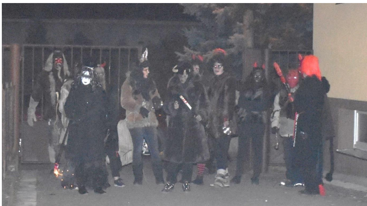
Obrázek 48: Za hasičskou zbrojnicí přišla spousta čertů.