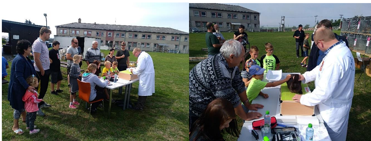
Obrázek 89 a 2: Posuzování jednotlivých plemen králíků.

V letošním roce jsme 17. srpna uspořádali výstavu králíků v Pustiměři. Zázemí