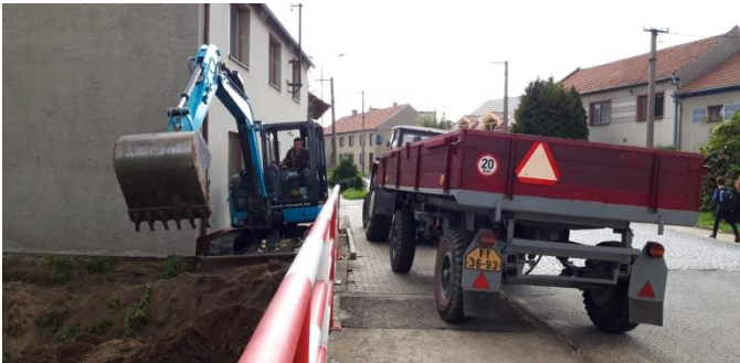
Obrázek 23: Vytěženou hlínu sousedé odvezli na vyhrazené místo traktorem s vlečkou.

Získali je všechna. Vypůjčili si potřebnou techniku. Pak teprve se pustili do práce. Po několika hodinách úsilí za přísného dohledu kolemjdoucích se v potoce objevila tekoucí voda – známka toho, že si našla správný směr svého putování krajinou a opustila sklepní prostory přilehlých domů.