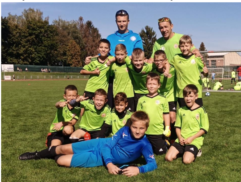
Obrázek 84: Po výhře 6:2 nad Vyškovem A.

V jarní části se budeme snažit navázat na podzimní úspěchy. Kvalitu a odhodlání na to určitě máme. Jsem sám velmi zvědav, jak si tento parádní tým povede v přímé konfrontaci s vítězi zbývajících skupin.