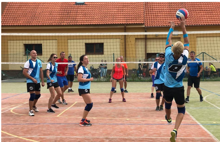
Obrázek 58: Boj byl urputný.

Co se týče podmínek účasti, v každém týmu musely být zastoupeny minimálně dvě ženy v 6tičlenném týmu amatérských hráčů. S sebou měli vzít hlavně dobrou náladu a zápisné, které bylo použito na zakoupení cen a náklady s tím